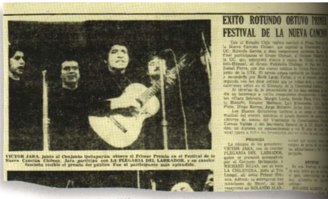
Víctor Jara junto a Quilapayún en el Primer Festival de la Nueva Canción Chilena en 1969.