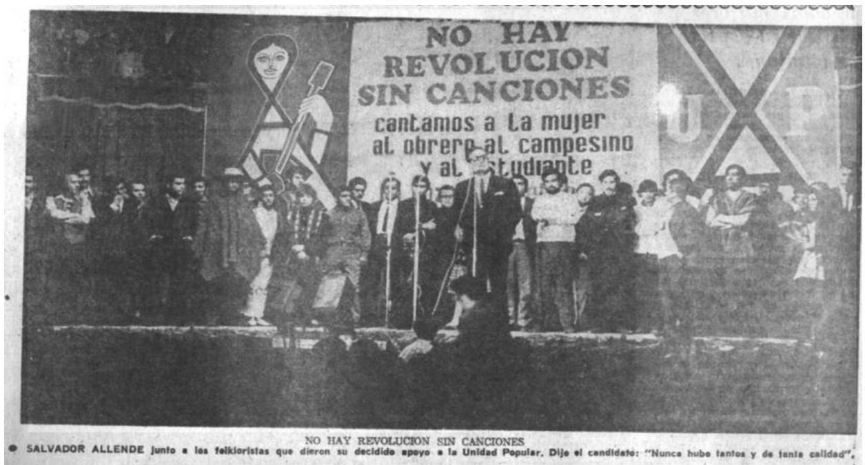
Encuentro de folkloristas en apoyo a la candidatura de Salvador Allende para la presidencia de 1970.