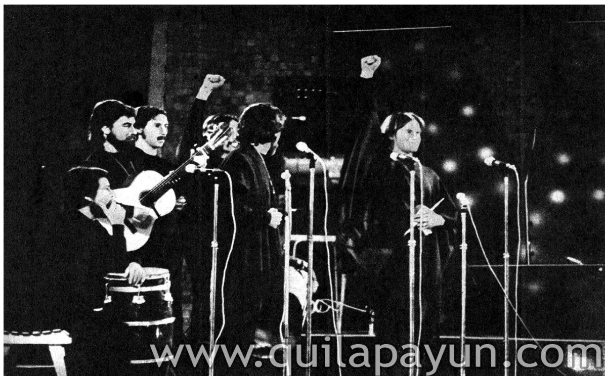
Quilapayún en su bullada presentación del Festival de Viña en febrero de 1973.