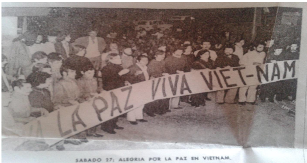
Cuarto Festival de la Canción Comprometida en Valparaíso en 1973.