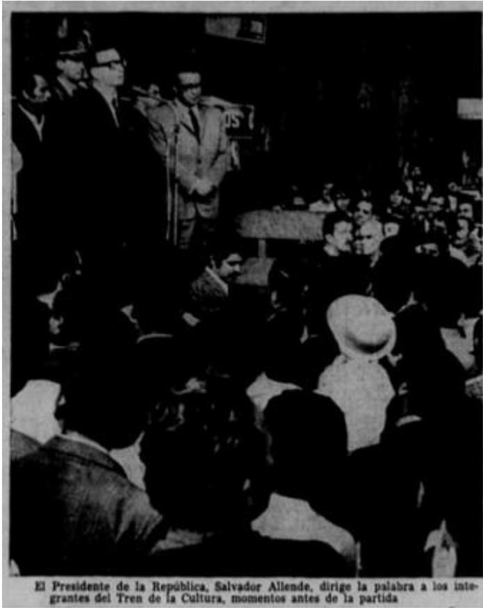
Salvador Allende se dirige a los integrantes que componen el “Tren de la Cultura”, en 1971.