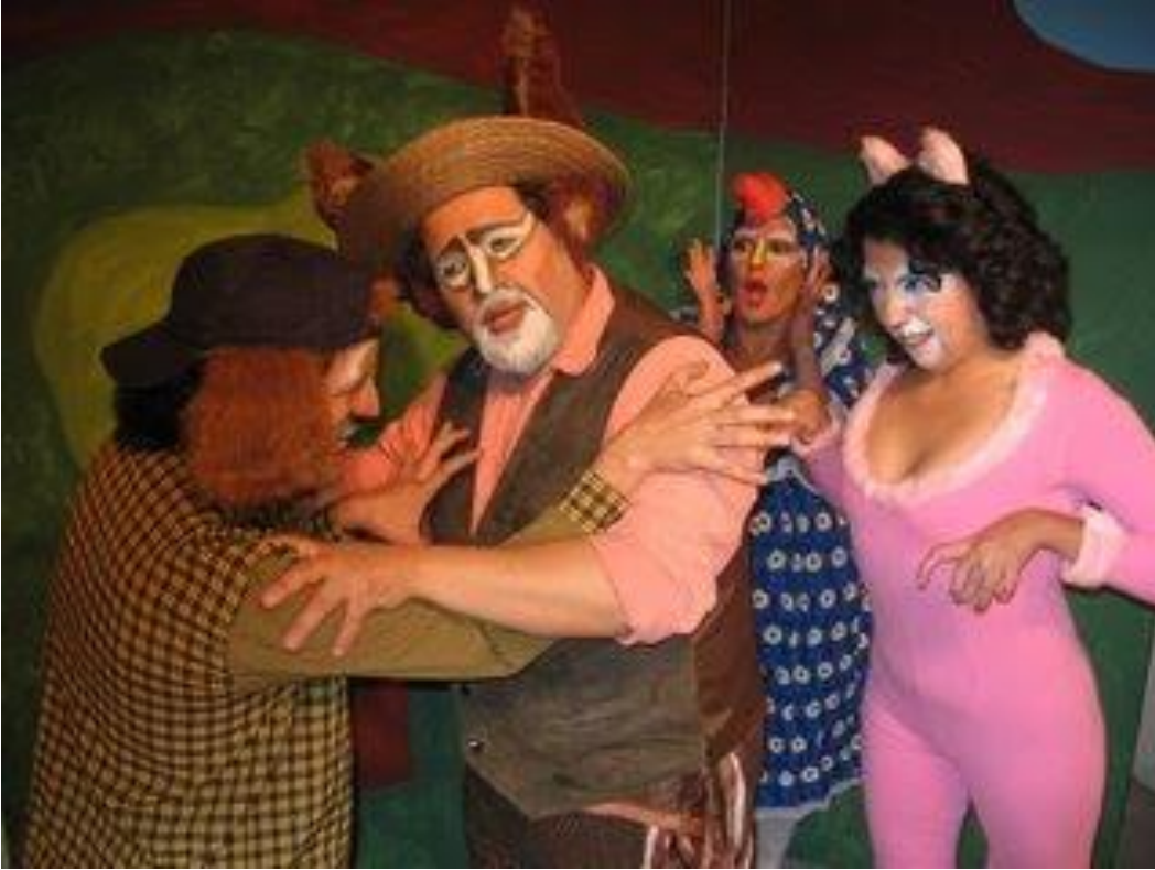
“LOS MUSICOS DEL CAMINO” (2004)