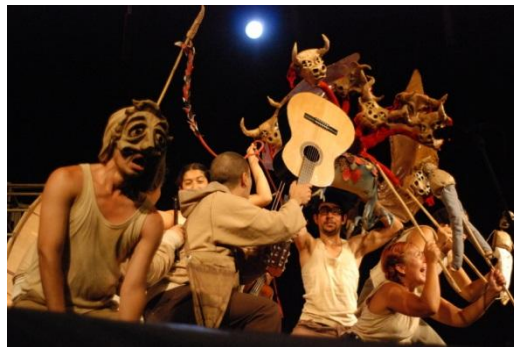
Cada día se presenta un pasacalle para difundir e invitar a los vecinos.