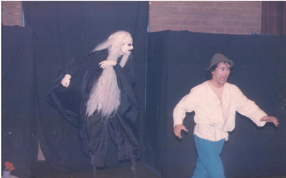
“HUARACA CON LA PELÁ” (1991)