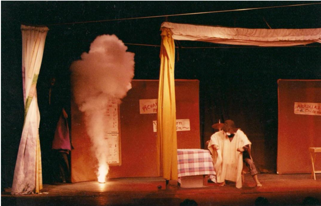
“FAUSTO MISERIA” (1994)