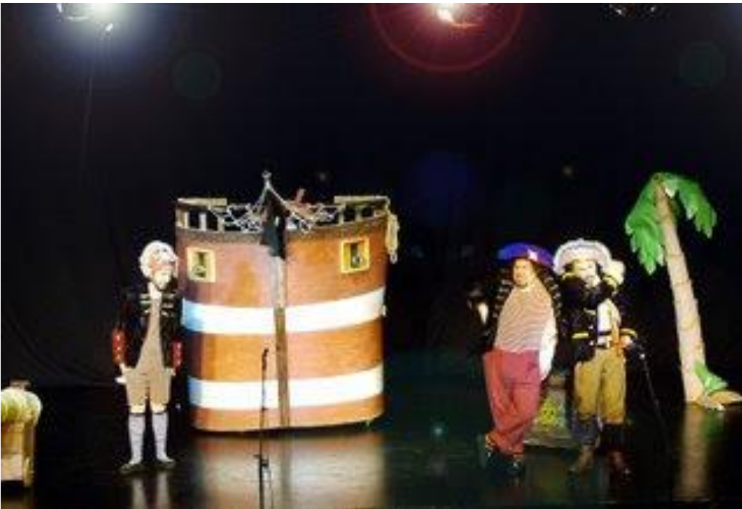
“LOS PIRATAS” (2008)