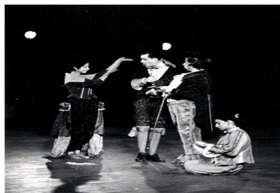
“NOCHE DE REYES Y RICARDO II” (1992)