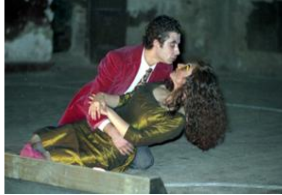
“LA NEGRA ESTER” (1988)