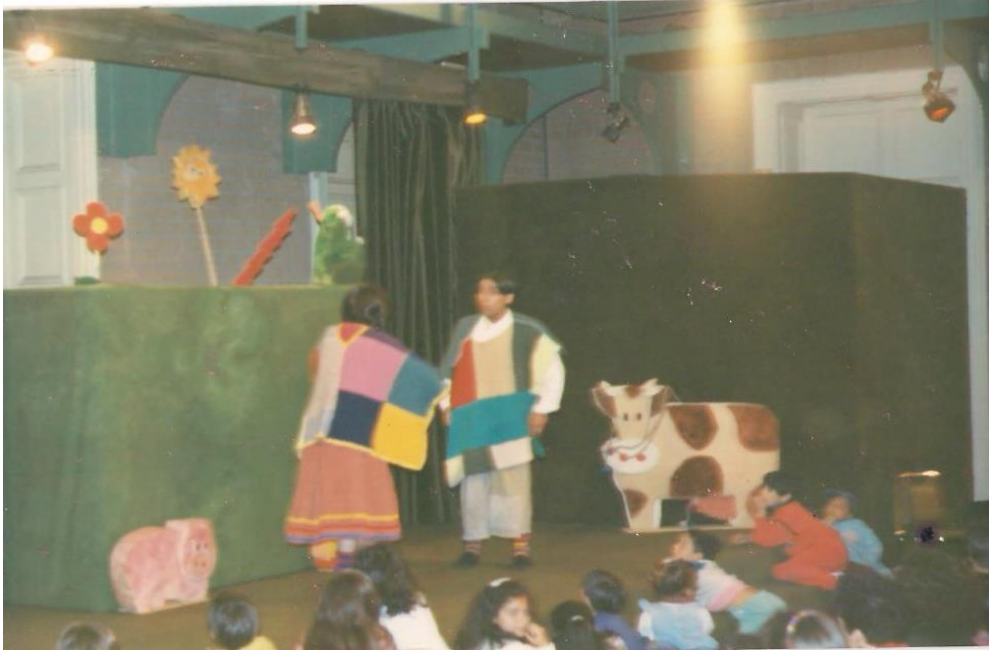
“EL BICHARRACO” (1992)