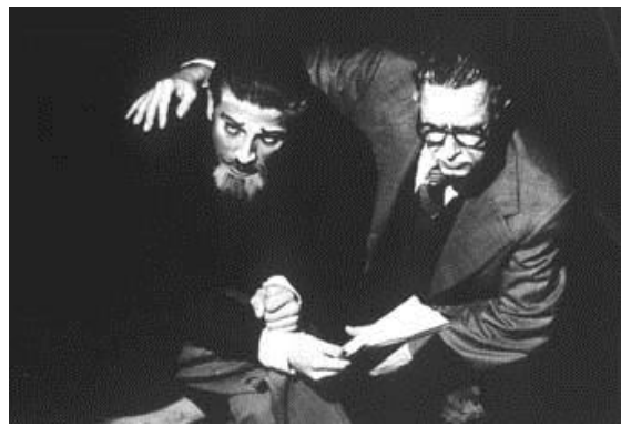
“EPOCA '70, ALLENDE” (1990)