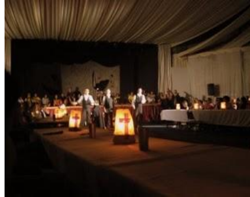
“DIALOGOS DE LA MERCED; O DONDE FUE QUE LA CAGAMOS” (2000)