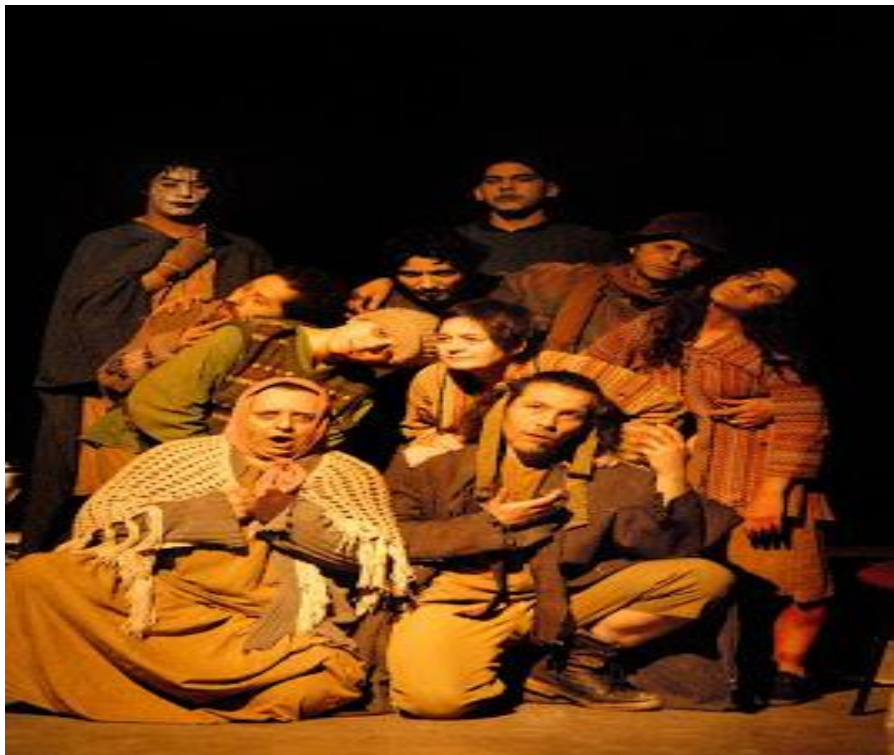
“LA GUERRA DE LA SOPA” (2008)