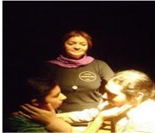
“EL SILENCIO DE LA MUSICA” (2010)