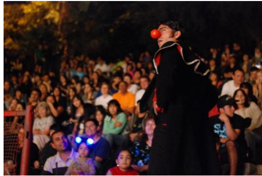
Público y actores muy cerca en Anfiteatro Pudahuel