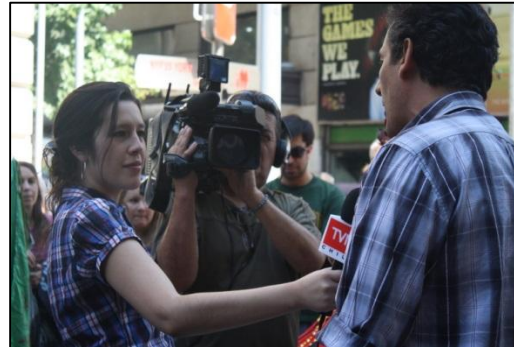
También se realiza un pasacalle en el centro de la capital.