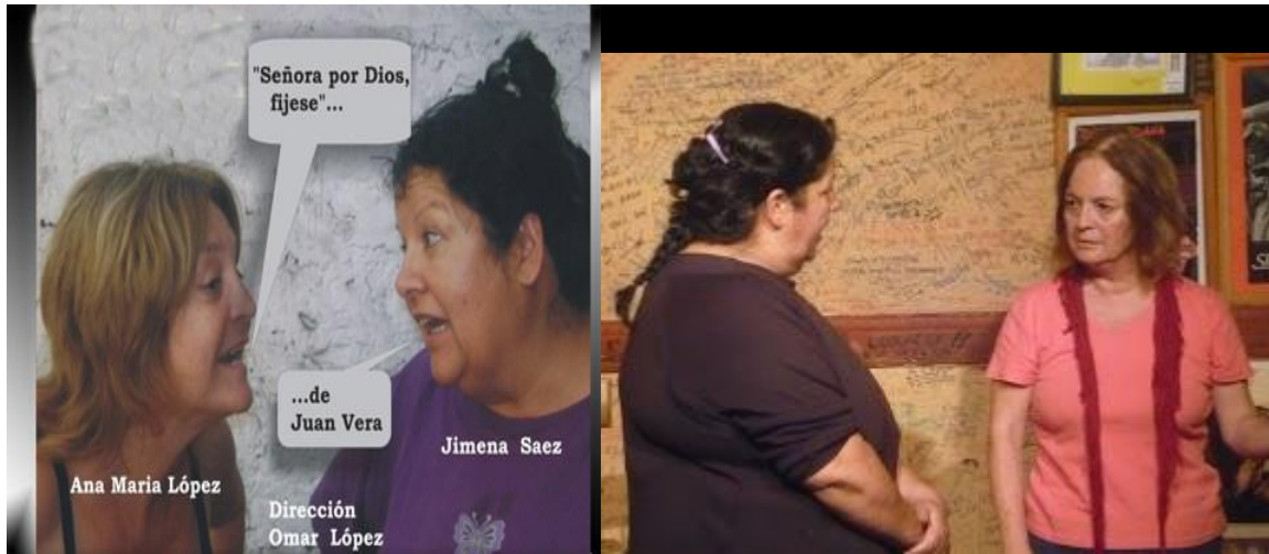
“SEÑORA POR DIOS... FIJESE” (2009)