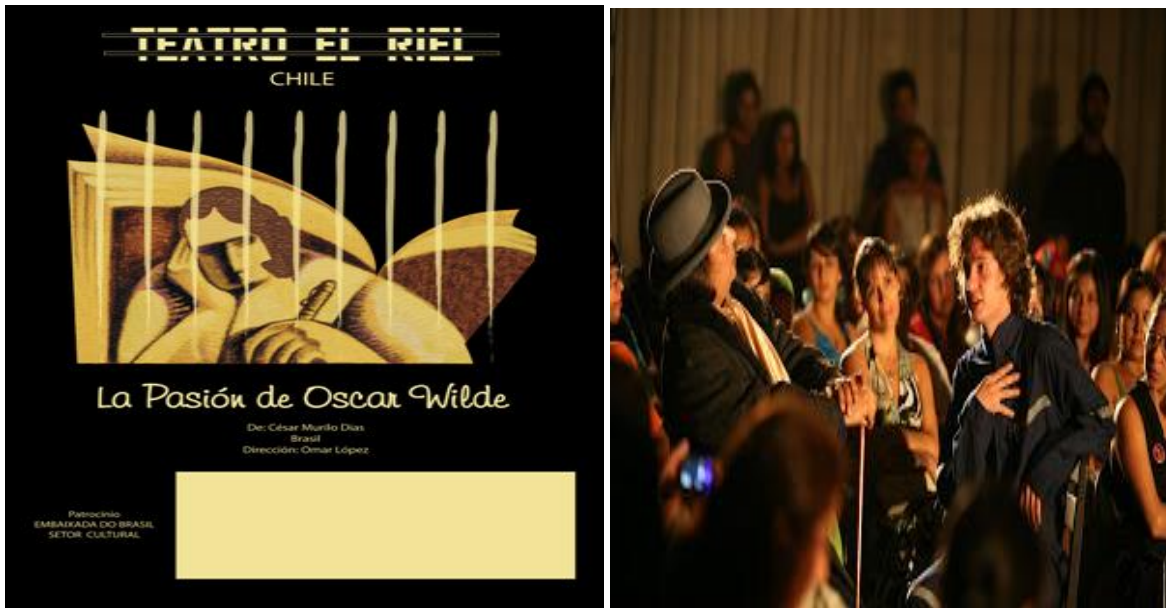
“LA PASION DE OSCAR WILDE” (2009)