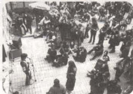
MUSICA. - Parte de los numerosos estudiantes que asistieron a la fiesta musical, cuando finalizaron las celebraciones.