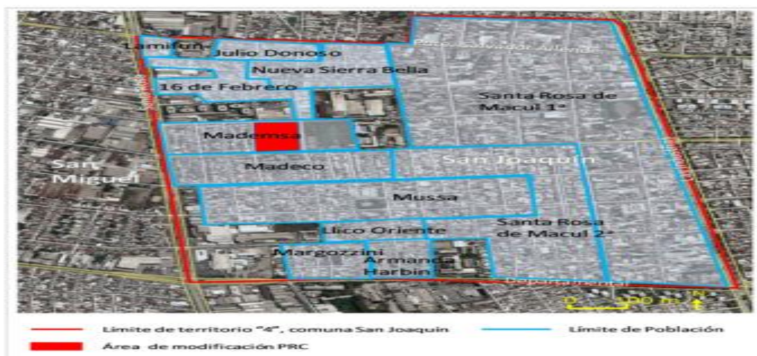
Imagen: Localización de la población la Mussa