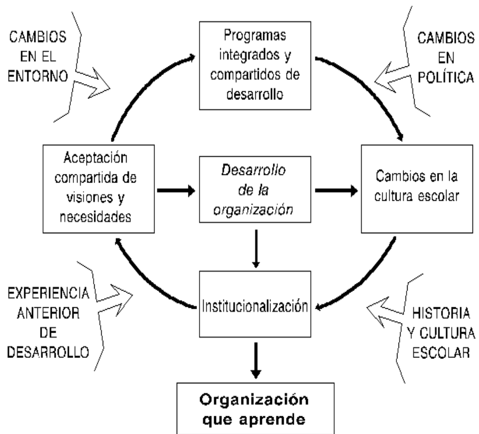
Figura: El centro educativo como organización que aprende

aprendizaje de los individuos y grupos, en un clima de aprendizaje continuo y mejora, es propio de una organización que ha situado el aprendizaje como su principal activo y valor. El aprendizaje organizativo no es la suma acumulativa de aprendizajes individuales; tienen que darse densas redes de colaboración entre los miembros pues, en ausencia de intercambio de experiencias e ideas, no ocurrirá.