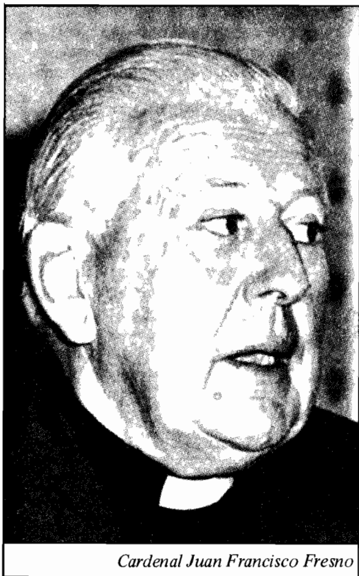
Cardenal Juan Francisco Fresno

La pertinencia de tales interrogantes es obvia frente a las críticas a los partidos. No nos referiremos a las que provienen de quienes niegan la importancia de los mismos y relativizan la democracia con todo tipo de adjetivos, sino a las voces de quienes creen en el papel de los partidos políticos. “Yo creo que el gran problema actual para los partidos, no sólo en Chile, sino que en general, es que el poder dejó de estar ubicado; no hay más, no existe más la conquista del poder, aunque se lo propongan; esa es la gran ilusión. El poder es difuso, está en todas partes y no está en ninguna. Ahora, que hay una parte que está en el Estado y en el gobierno, es evidente; pero uno puede hacer una revolución en un país, puede ganar el gobierno por elecciones, pero inmediatamente tiene el problema que el poder no termina en el Estado, como se