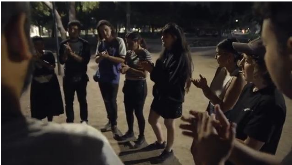
Anexo 6 Captura de imagen de Juerga planificada en el Parque Bustamante con el motivo del cierre de talleres para iniciación al cante. (2021)