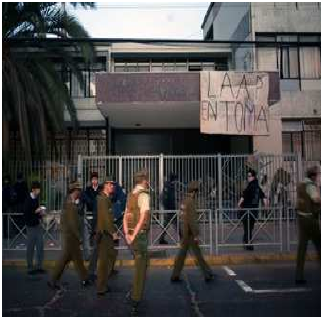
4 Fotografía sobre la toma de agosto del 2006.