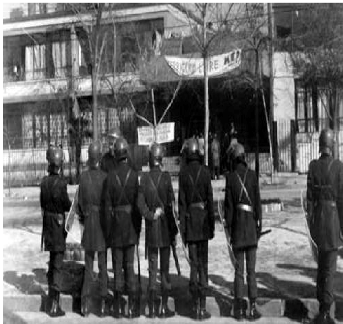
2 Fotografía de la toma de 1985, carabineros preparados a la espera de la orden de desalojo.