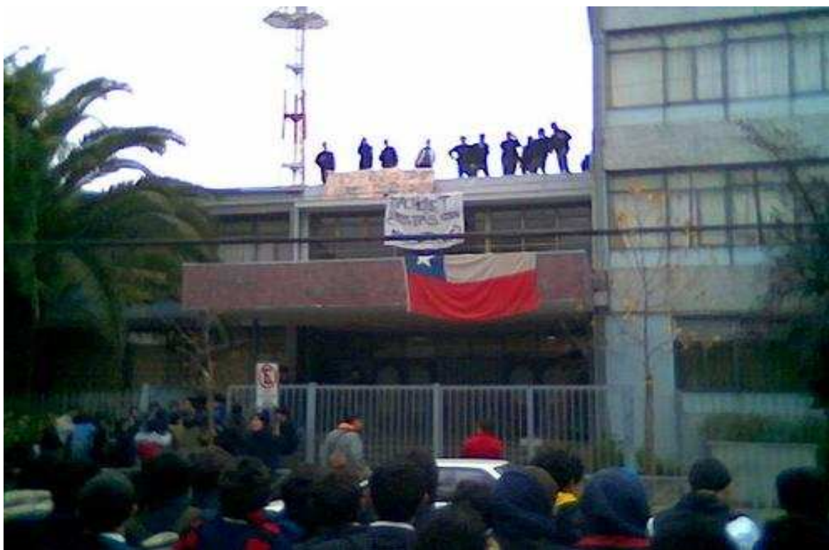
3 Fotografía de la toma del 21 de agosto del 2006.