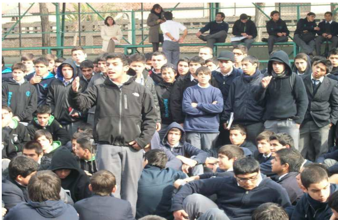
7 fotografía sacada en plena asamblea estudiantil 2006 en las galerías.

Finalmente logramos comprender que las gradas o más bien las galerías, son y han sido un lugar que por décadas ha permitido que los estudiantes alessandrinos configuren su propia realidad y experiencia de participación política en el movimiento estudiantil. Paralelamente las gradas contribuyen como un espacio – lugar de encuentro a la formación de una identidad propia de los jóvenes – estudiantes alessandrinos, sin ir más lejos las gradas son un espacio material que ha contribuido en el desarrollo de una identidad rebelde y luchadora que ha caracterizado a los jóvenes del “A-12” por décadas, proceso que ha mantenido al grupo seguir con los recuerdos del pasado, y los desafíos políticos del presente.