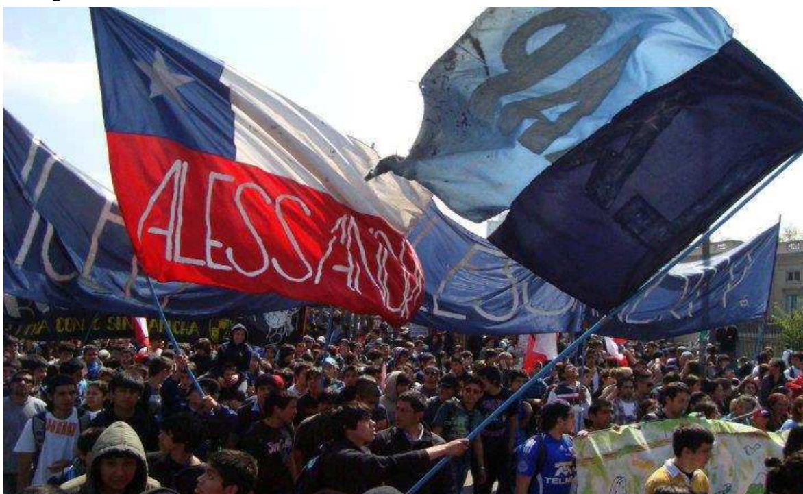
8 Fotografía sacada a los estudiantes alessandrinos durante la movilización estudiantil 2011.

https://www.facebook.com/liceoarturo.alessandripalmamovilizado/photos_albums