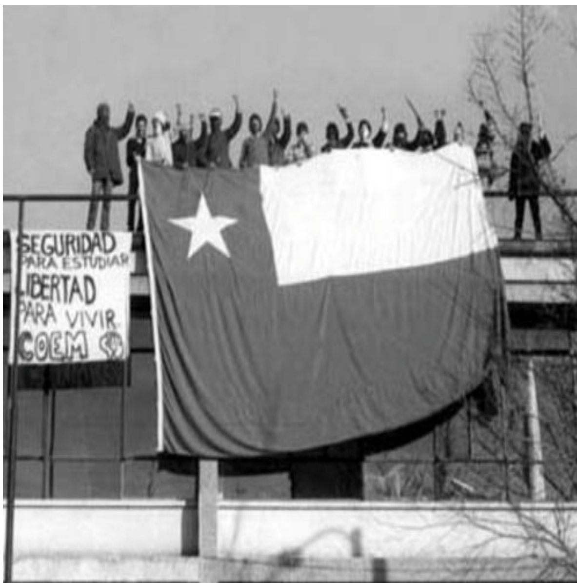
1 Fotografía sobre la toma del liceo Arturo Alessandri Palma en 1985

Diario el Mercurio, Santiago de Chile, 11 de julio de 1985.