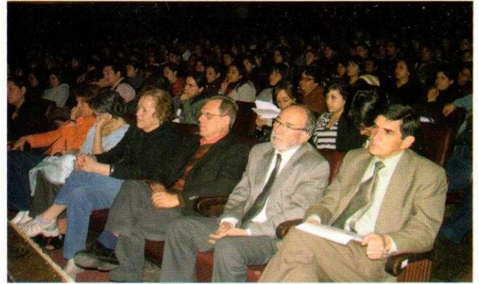
Un aspecto de la concurrencia al acto inaugural en el Teatro Cariola

El acto recibió el saludo artístico del destacado charanguista Freddy Torrealba, quien interpretó un tema de su propia producción y "La partida" de Víctor Jara, que arrancó una prolongada ovación de los presentes.