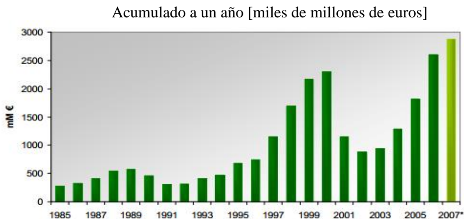
Gráfico 1: Volumen Mundial invertido en fusiones y adquisiciones [1985 - 2007]