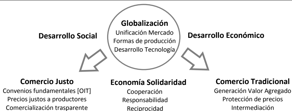
Figura N°1: Elementos Contextuales de la Economía Global

Para lograr entender por qué el Comercio Justo, que nace hace más de quince años 9 como una alternativa al comercio internacional tradicional, es necesario entender ciertos conceptos de la economía que explican las razones del desarrollo de algunos países versus el subdesarrollado de otros, donde por largo tiempo se ha explicado esto como un retraso de su crecimiento, debido a la falta de estrategia productiva (Bisaillon, et al., 2013). De este modo, la Figura N°1 sintetiza el contexto económico global en el que se desarrolla el Comercio Justo, articulando los principales conceptos concomitantes requeridos para comprender el caso chileno.