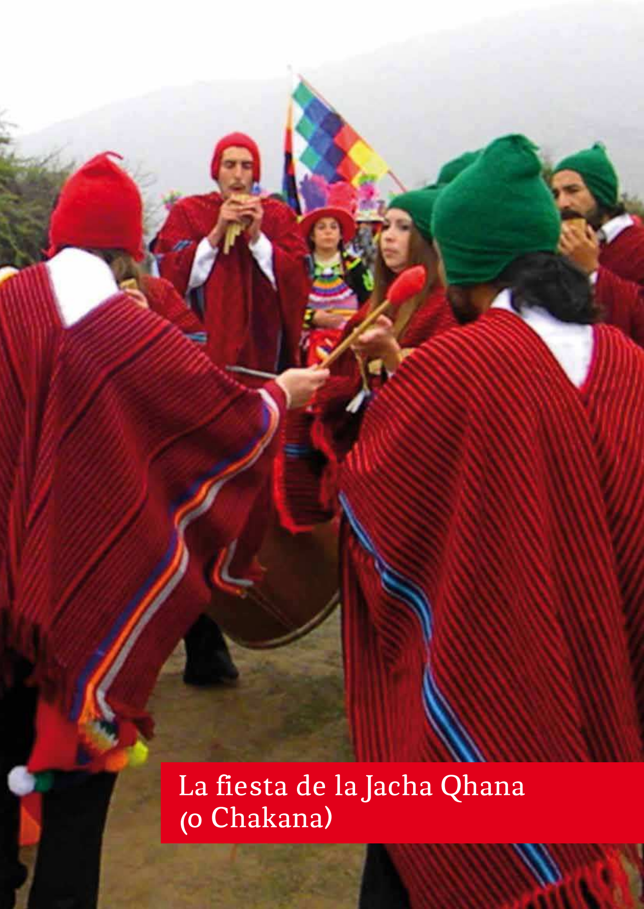
La fiesta de la Jacha Qhana (o Chakana)