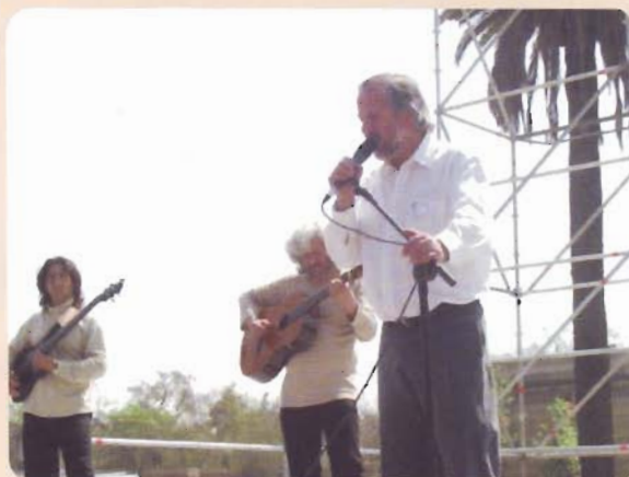
Actuación de artistas y estudiantes de la Escuela de Danza que dirigió el gran coreógrafo.