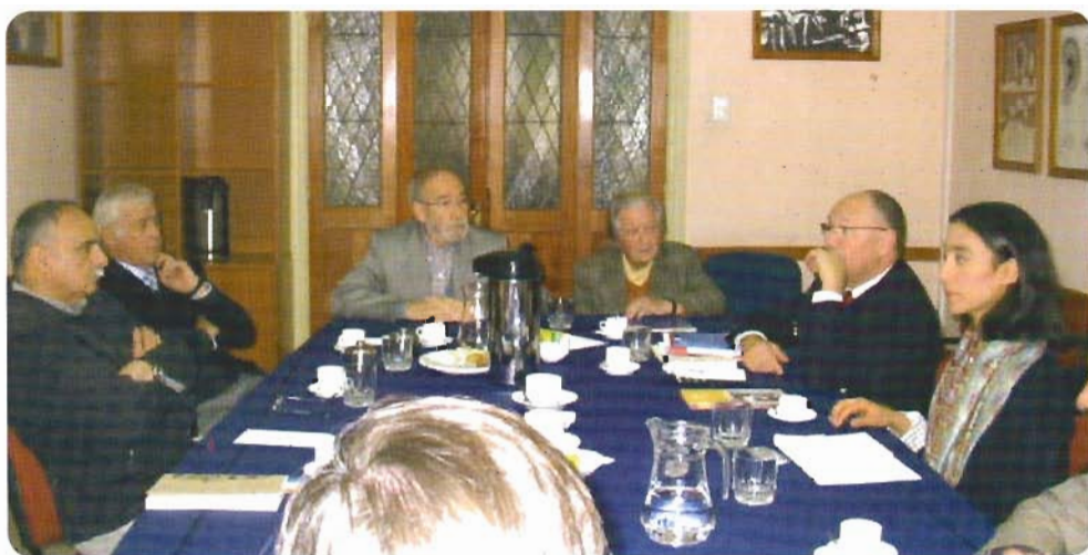
La reunión entre representantes de ambas universidades.