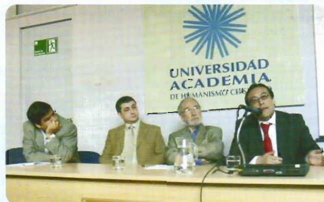
Durante la inauguración del seminario.