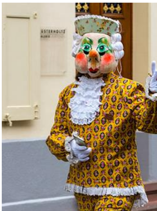
Figura 6. Imagen tomada del Carnaval de Basel.

c) Cliquen : Las primeras Cliquen surgieron hacia mediados del siglo XIX, a partir de diferentes sociedades y agrupaciones de Basilea. Alrededor del año 1870, se constituyeron las primeras sociedades destinadas exclusivamente a participar en el Carnaval. A menudo correspondían a barrios o suburbios de Basilea, lo que aún se refleja en algunos de sus nombres como Stainlemer , Spale o Glaibasler . Durante los tres días del Carnaval, las Cliquen recorren las calles con tambores y pífanos, tocando marchas tradicionales o ritmos más modernos. ( basel.com ).