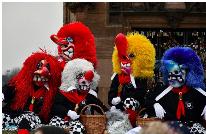
Figura 5. Imágenes tomadas del Carnaval de Basel.