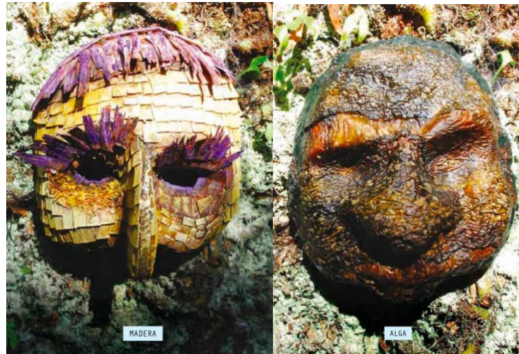
Figura 11.

Esta máscara es expresiva, ya que en el diseño se encuentra una dicotomía de emociones para que el histrión pueda comunicar emociones a través del movimiento, estas máscaras contienen las mismas características que cualquier máscara expresiva de uso teatral, son asimétricas.