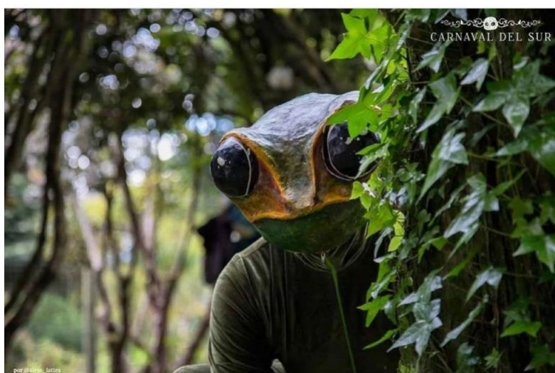
Figura 2. Máscara Carnaval del Sur. Elaboración propia.

En este sentido, si se ha observado a un caballo, se deberá encontrar en primer lugar, dónde se aloja su motor de desplazamiento. Como se mencionó anteriormente, es preciso acudir a la repetición para lograr el ímpetu y elegancia que distingue al animal. Se complejiza aún más, cuando se debe diferenciar el movimiento de cada especie y raza.