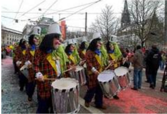
Figura 7. Imagen tomada del Carnaval de Basel.

Ésta familia de máscaras, entre otras tan peculiares, fueron la inspiración para que el maestro Lecoq pudiera abordar la creación de una máscara que trabajará en dos direcciones, abordado la animalidad y su dimensión fantástica, pues: