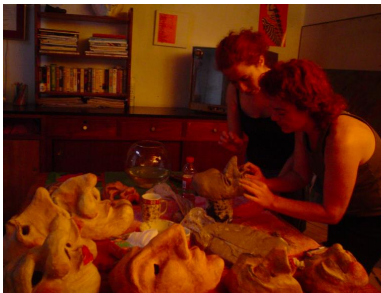
Figura 8. Imagen máscaras primitiva y carácter.

(dependiendo de su calidad de detalle), tendremos que inclinar nuestra cabeza sólo 15°, con una tensión nivel cinco para provocar el mismo efecto, debido a que la historia que ya nos cuenta la morfología y particularidad de la máscara, completa la medida justa para entrar en la convención. Exactamente lo mismo sucederá con cada una de las partes de nuestro cuerpo, no será necesaria una energía desbordante para hacer vivir la máscara, por el contrario, serán movimientos sutiles y justos los que mantendrán a la máscara viva. Debido a ello, una situación dramática de máscaras primitivas nos permitirá empatizar más con los personajes, debido a su acercamiento a las características humanas.