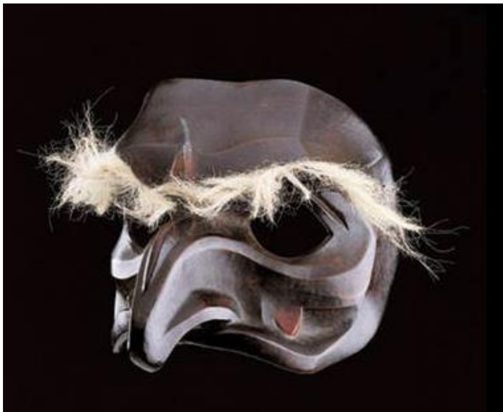
Figura 10. Máscara Pantaleón de Amletto Sartori