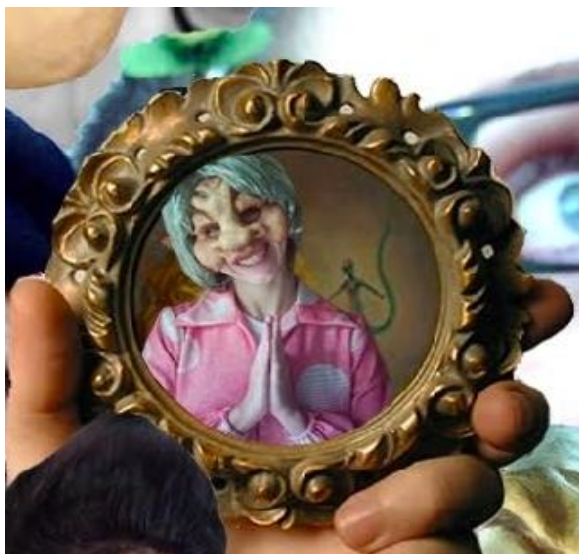
Figura 9. Imagen original Comedia Humana.