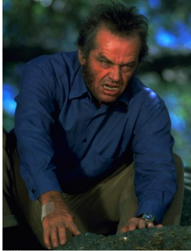
Figura 3. Imágenes tomadas de la película Wolf .