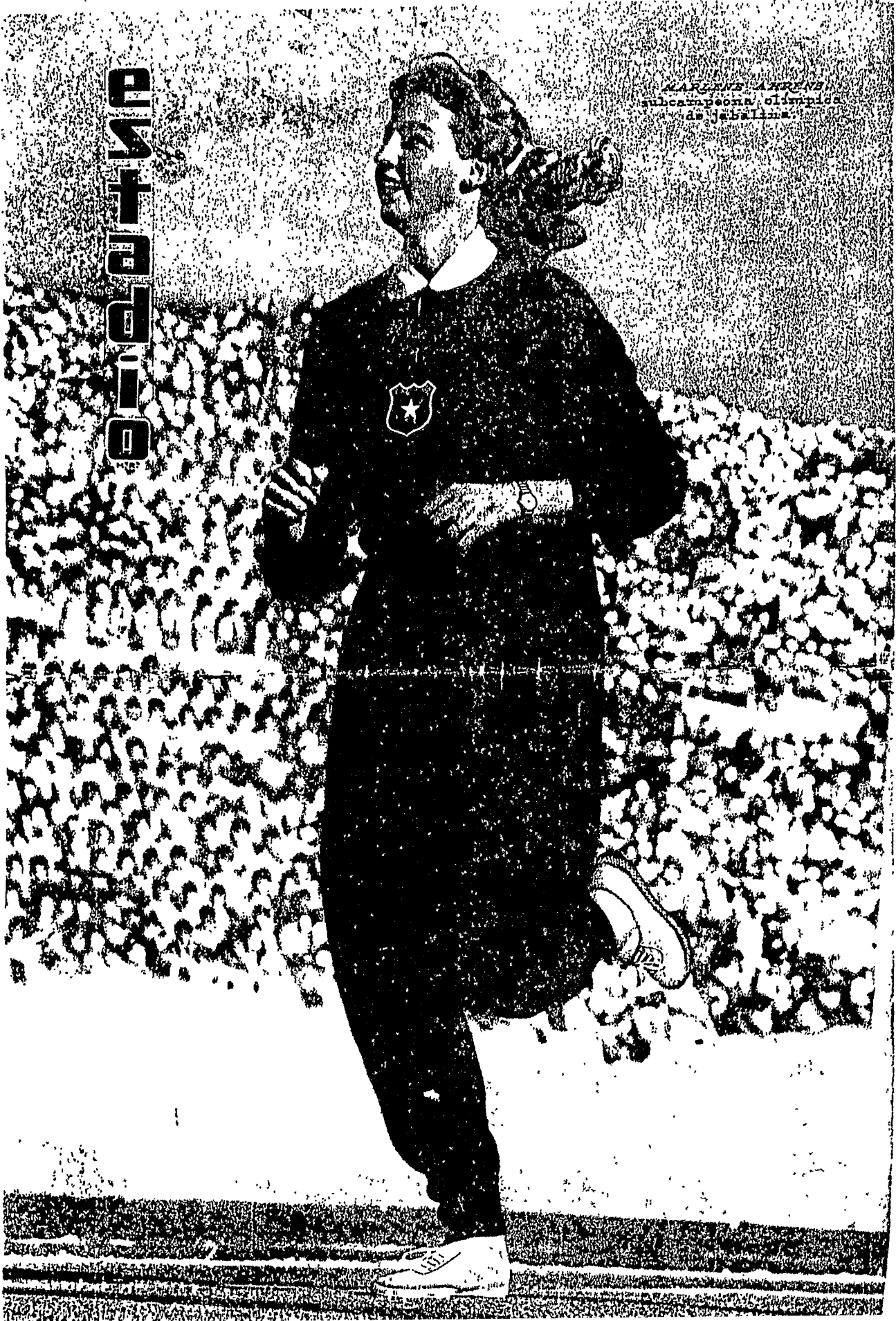
MARION PHOENIX subcampeona olímpica de jabalina.