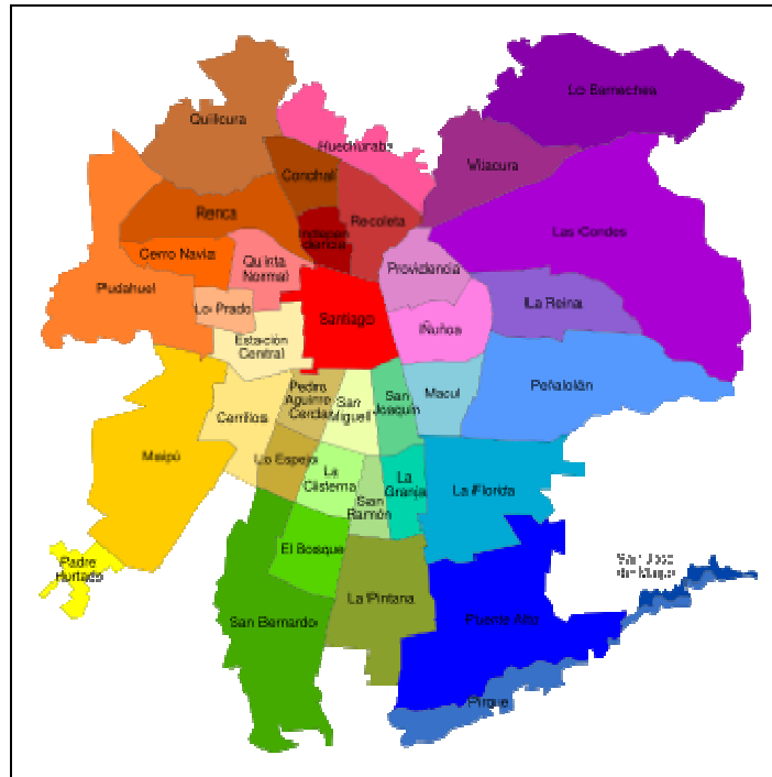
(PLAN ESTRATÉGICO DE DESARROLLO COMUNAL SANTIAGO 2010:12)