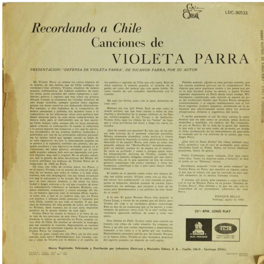
Figura 2. Caratula de vinilo “Violeta Parra (una chilena en Paris) Recordando a Chile”, composiciones Violeta Parra, Santiago, EMI Odeón Chilena, LDC- 36533, 1965, Colección Fondo Violeta Parra, Santiago, Chile. Todas las fotografías son del autor y los discos pertenecen a la misma colección a menos que se especifique algo diferente. (Parra M. V., 2020)