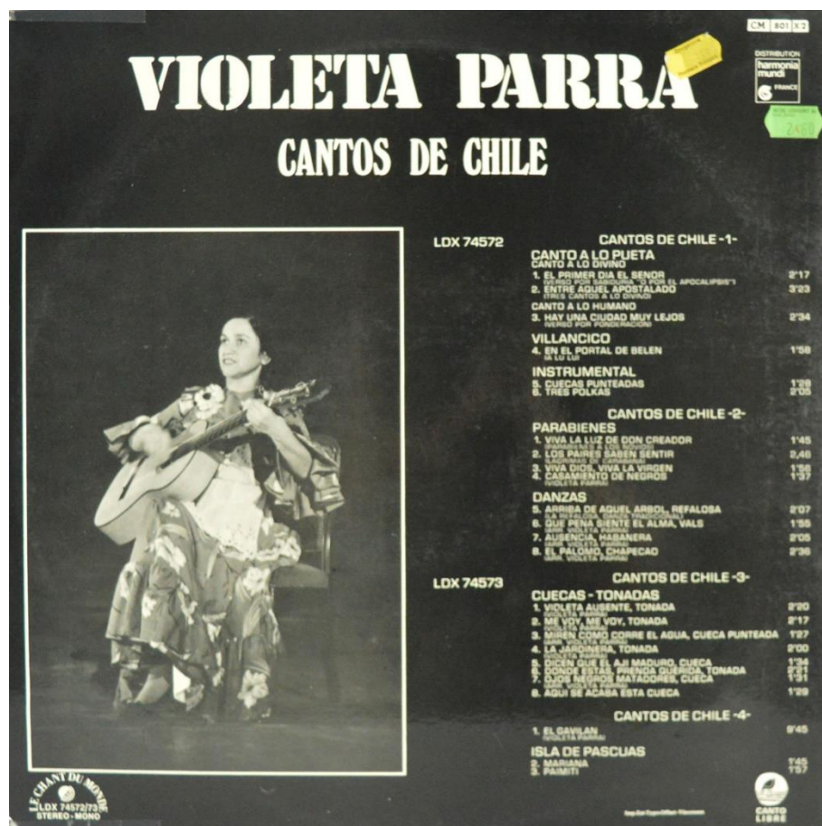
Figura 11. Caratula de vinilo “Violeta Parra Presente... Ausente...Cantos de Chile”, composiciones Violeta Parra, Francia, Sello LP Chant du Monde, LDX 74572/73, 1975, Colección Fondo Violeta Parra, Santiago, Chile. Todas las fotografías son del autor y los discos pertenecen a la misma colección a menos que se especifique algo diferente.

Fondo Violeta Parra, Santiago, Chile. Todas las fotografías son del autor y los discos pertenecen a la misma colección a menos que se especifique algo diferente.