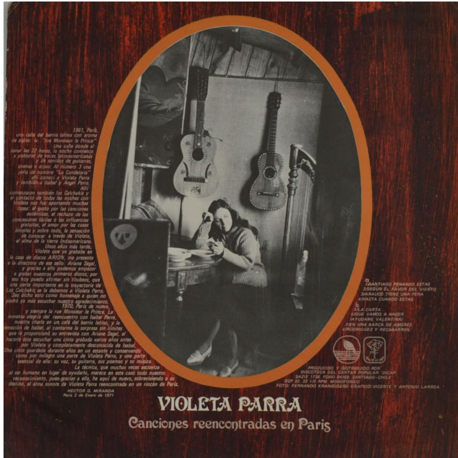
Figura 9. Caratula de vinilo “Violeta Parra. Canciones, reencontradas en Paris”, composiciones Violeta Parra, Santiago, Sello DICAP, DCP 22. 33 1/3 RPM. Monofónico, 1971, Colección Fondo Violeta Parra, Santiago, Chile, fotografía de Gabriel Valdés. Todas las fotografías son del autor y los discos pertenecen a la misma colección a menos que se especifique algo diferente.