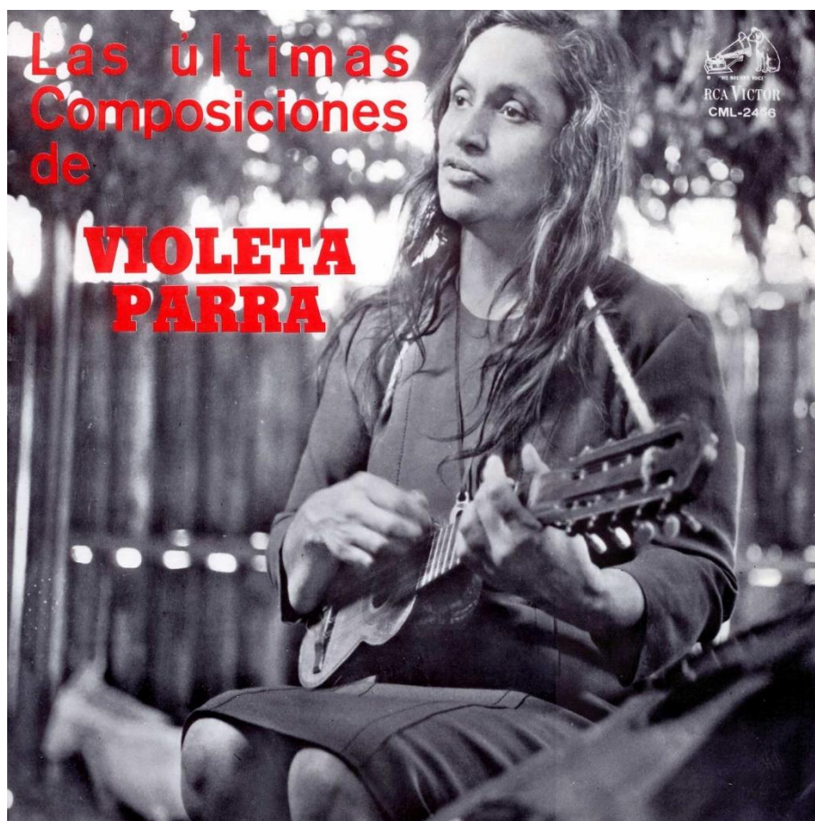
Figura 4. Caratula de vinilo “Las ultimas composiciones de Violeta Parra”, composiciones Violeta Parra, Santiago, Sello RCA Víctor, CML-2456, 1966, Colección Fondo Violeta Parra, Santiago, Chile. Todas las fotografías son del autor y los discos pertenecen a la misma colección a menos que se especifique algo diferente.