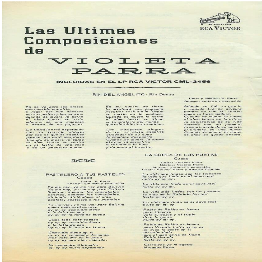
Figura 6. Caratula de vinilo “Las ultimas composiciones de Violeta Parra”, composiciones Violeta Parra, Santiago, Sello RCA Víctor, CML-2456, 1966, Colección Fondo Violeta Parra, Santiago, Chile. Todas las fotografías son del autor y los discos pertenecen a la misma colección a menos que se especifique algo diferente.