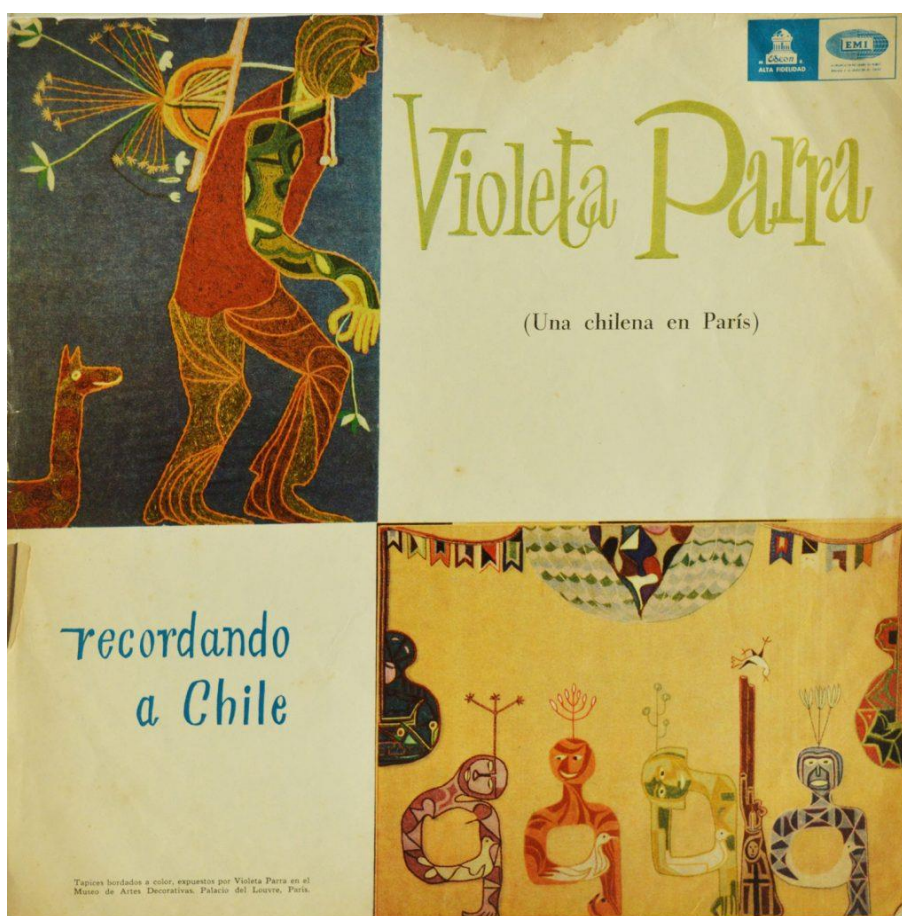
Figura 1. Caratula de vinilo “Violeta Parra (una chilena en Paris) Recordando a Chile”, composiciones Violeta Parra, Santiago, EMI Odeón Chilena, LDC- 36533, 1965, Colección Fondo Violeta Parra, Santiago, Chile. Todas las fotografías son del autor y los discos pertenecen a la misma colección a menos que se especifique algo diferente. (Parra M. V., 2020)