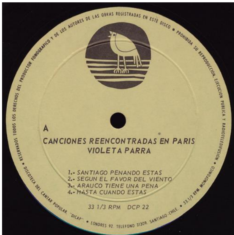
Figura 10. Etiqueta central, LP, 12”, Canciones reencontradas en París, Santiago, Dicap, DCP 22. 33 1/3 RPM, microfónico, 1971.

Producido y distribuido por Discoteca del Cantar Popular DICAP. Sazie 1738, fono 64169 Santiago – Chile. DCP 22. 33 1/3 RPM. Monofónico. Recopilación por parte de los hijos de Violeta Parra de canciones inéditas.