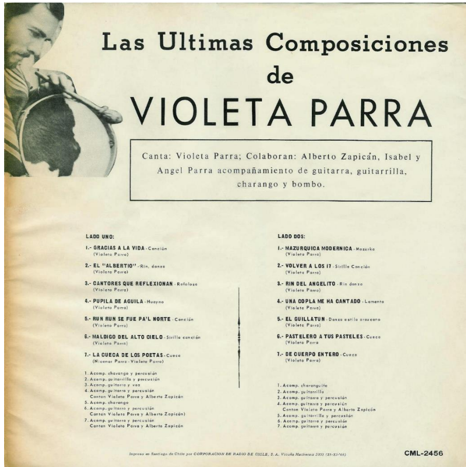
Figura 5. Caratula de vinilo “Las últimas composiciones de Violeta Parra”, composiciones Violeta Parra, Santiago, Sello RCA Víctor, CML-2456, 1966, Colección Fondo Violeta Parra, Santiago, Chile. Todas las fotografías son del autor y los discos pertenecen a la misma colección a menos que se especifique algo diferente.