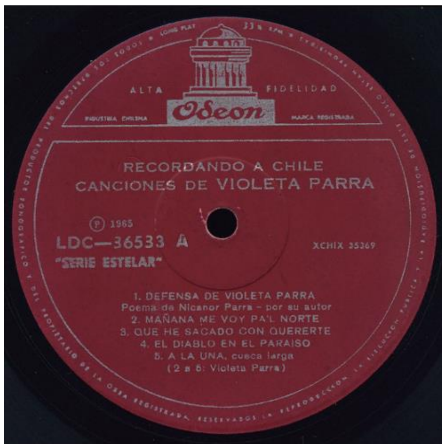
Figura 3. Etiqueta central, LP, 12”, Recordando a Chile/Una chilena en París, Santiago, Odeón LDC 36533, 1965.

Composiciones de Violeta Parra, música en vivo registrada en Ginebra y Argentina. CHI: EMI Odeón Chilena, LDC- 36533. Mono. Colección: Fondo Violeta Parra. Código: FVP0006. Autor: Parra, Violeta. Editor: EMI Odeón Chilena. Fecha: 1965, Santiago de Chile. Originales: Museo Violeta Parra. Idioma: español. Tipo: Sonoro. Extensión: 1 disco.