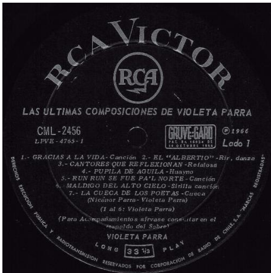
Figura 9. Etiqueta central, LP, 12”, Las últimas composiciones de Violeta Parra, Santiago, RCA Víctor, CML-2456, 1966.

Es el último álbum editado en vida por Violeta Parra. El disco incluye la mayoría de sus canciones más conocidas, como “Gracias a la vida”, “Run Run se fue pa’l norte”, “Cantores que reflexionan”, “Volver a los 17” y “La cueca de los poetas”, la cual escribió junto a su hermano Nicanor Parra. El registro fue editado en 1966 por la compañía RCA Víctor. Los acompañamientos instrumentales de guitarra, guitarrilla, charango y bombo son de Isabel y Ángel Parra, junto a Alberto Zapicán. La Revista Rolling Stone Chile, en abril de 2008, eligió este álbum como el mejor disco nacional de todos los tiempos.