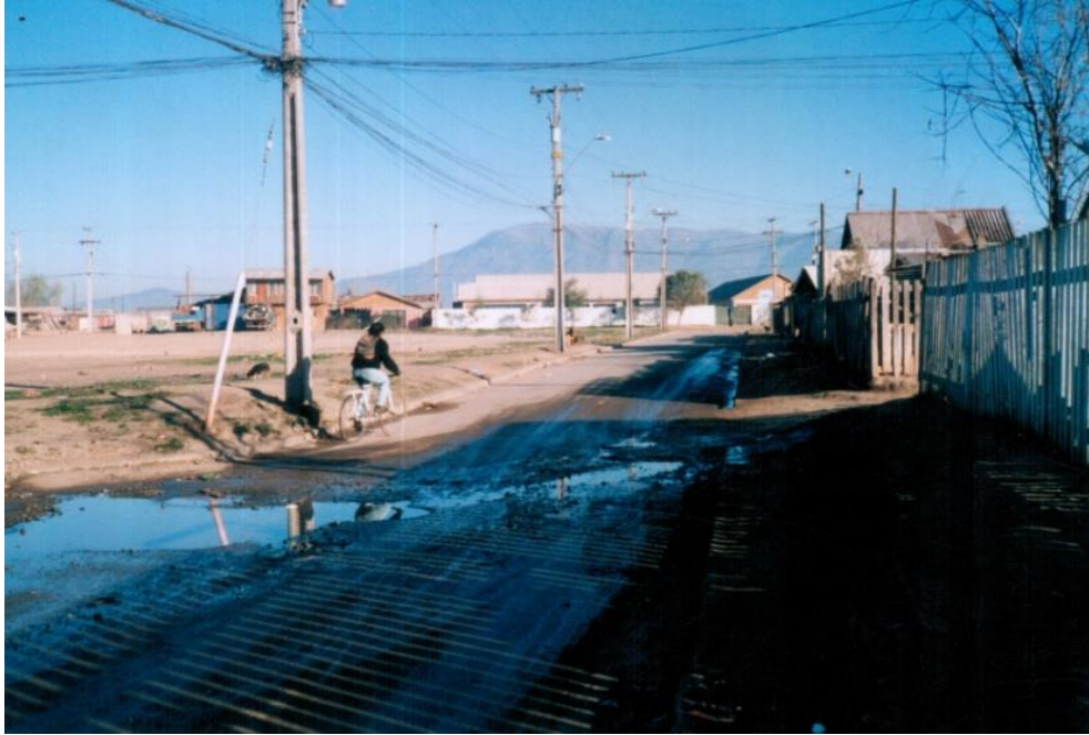
Calle Santa Marta, al fondo de la foto se logra ver el colegio San Luis Beltrán.