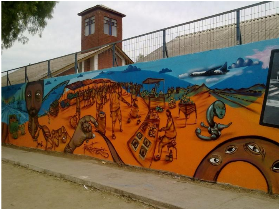
Mural realizado por alumnos del colegio san Luis Beltrán, gente del sector, y otros establecimientos, con un enfoque marcado en “La Historia de Pudahuel”.