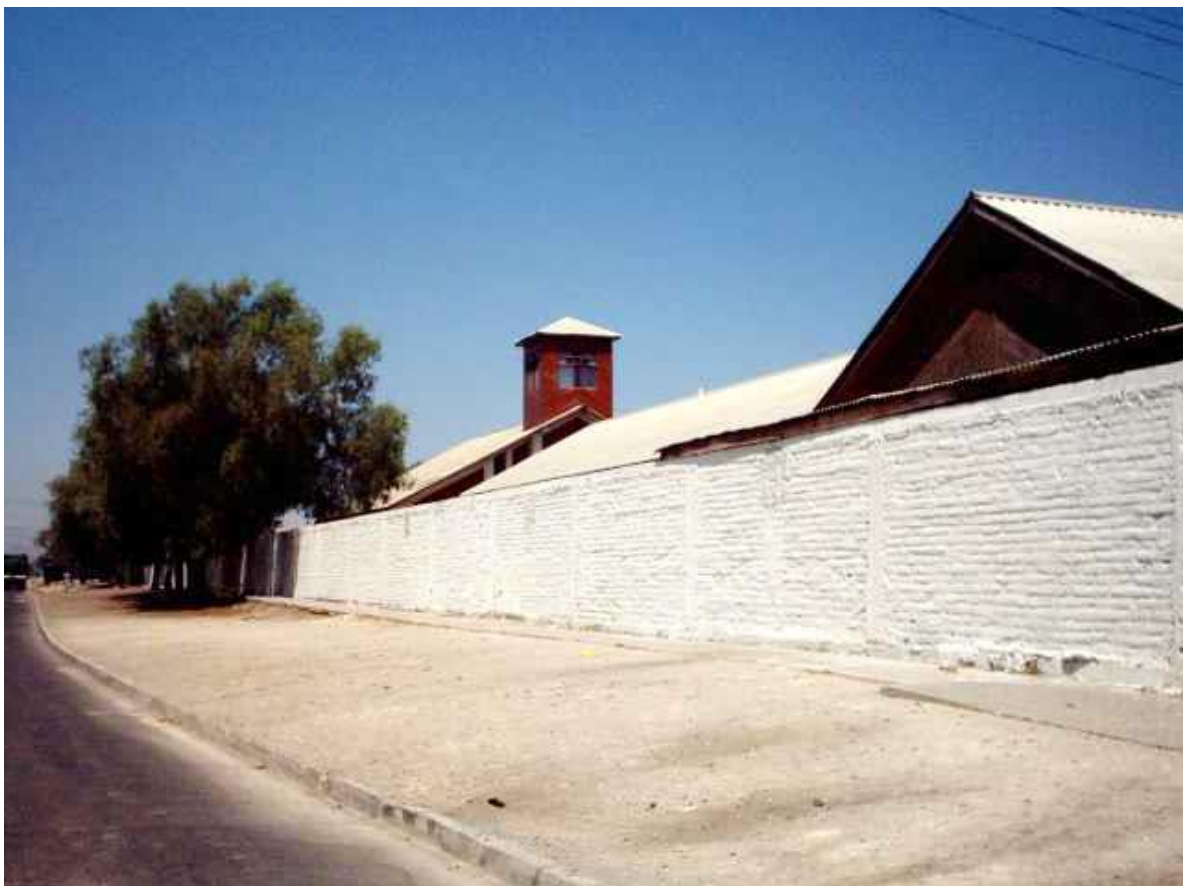
Vista del colegio san Luis beltran desde el costado que da hacia la calle Avenida el tranque.