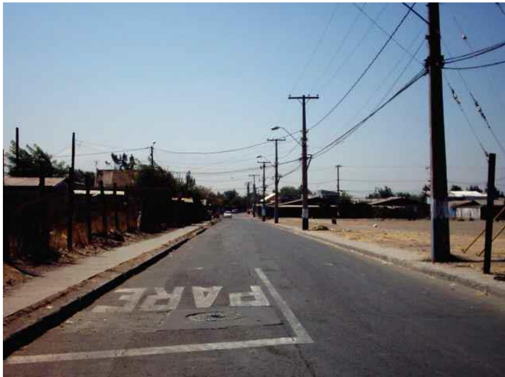
Vista antigua de la calle Santa Marta con dirección hacia al oriente. (Fuente: Troncoso, 2006).