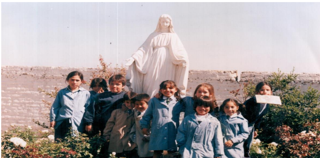
Vista interna del colegio, estudiantes en el “Patio de la virgen”.