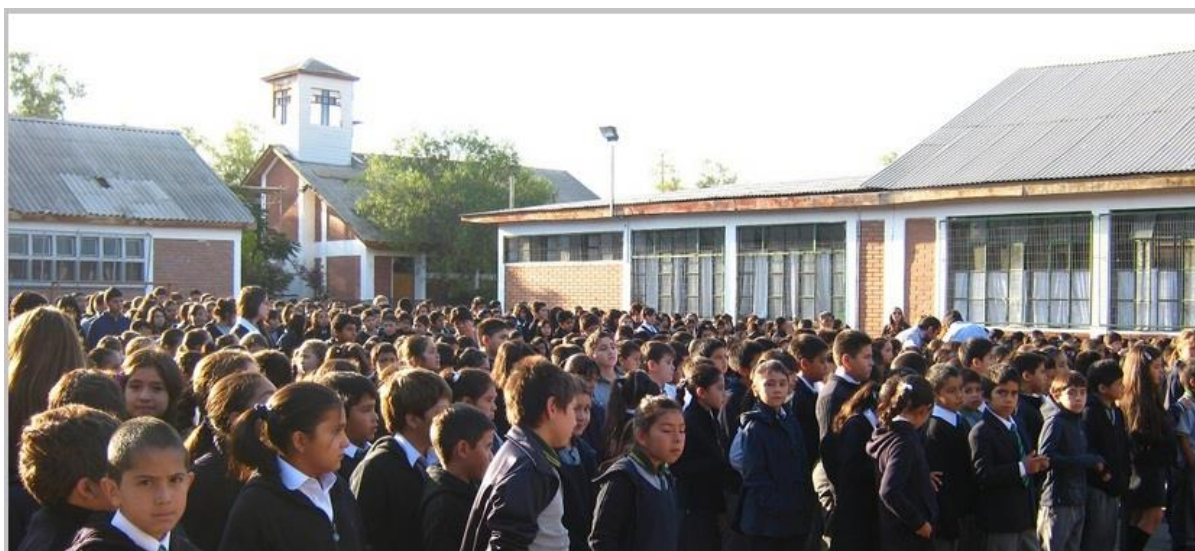
Vista interna del colegio, donde se encuentra gran parte de los estudiantes en el acto de inicio de actividades escolares