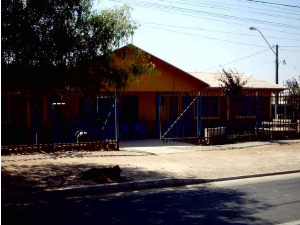
Sede vecinal ubicada en Av. el tranque.