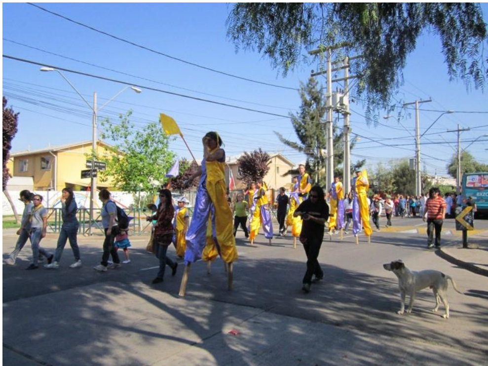
Estudiantes y gente de la comunidad realizando pasacalles por los barrios aledaños al colegio