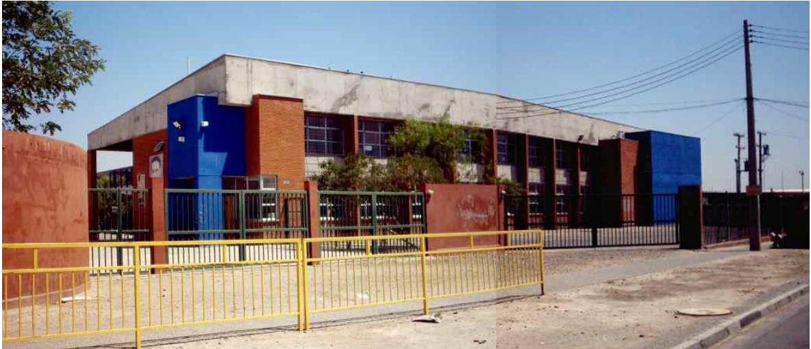
Vista frontal de la entrada del colegio. En esta imagen se muestra la magnitud total del colegio en terminos de crecimiento espacial. (Fuente: Troncoso, 2006).