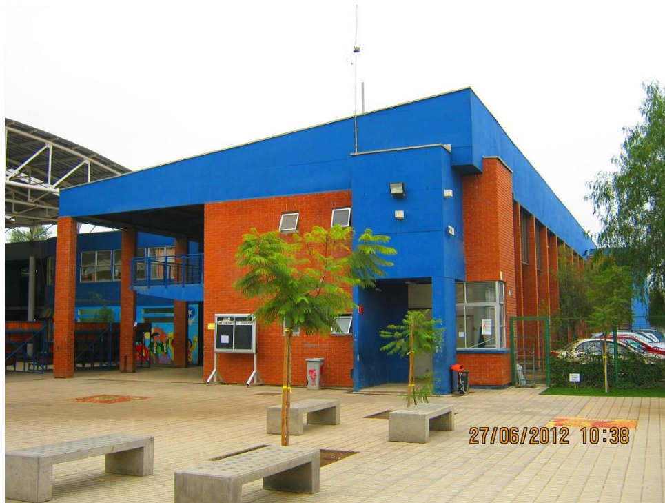
Vista interna del colegio san Luis Beltrán, donde se aprecian su visión actual y los cambios estructurales