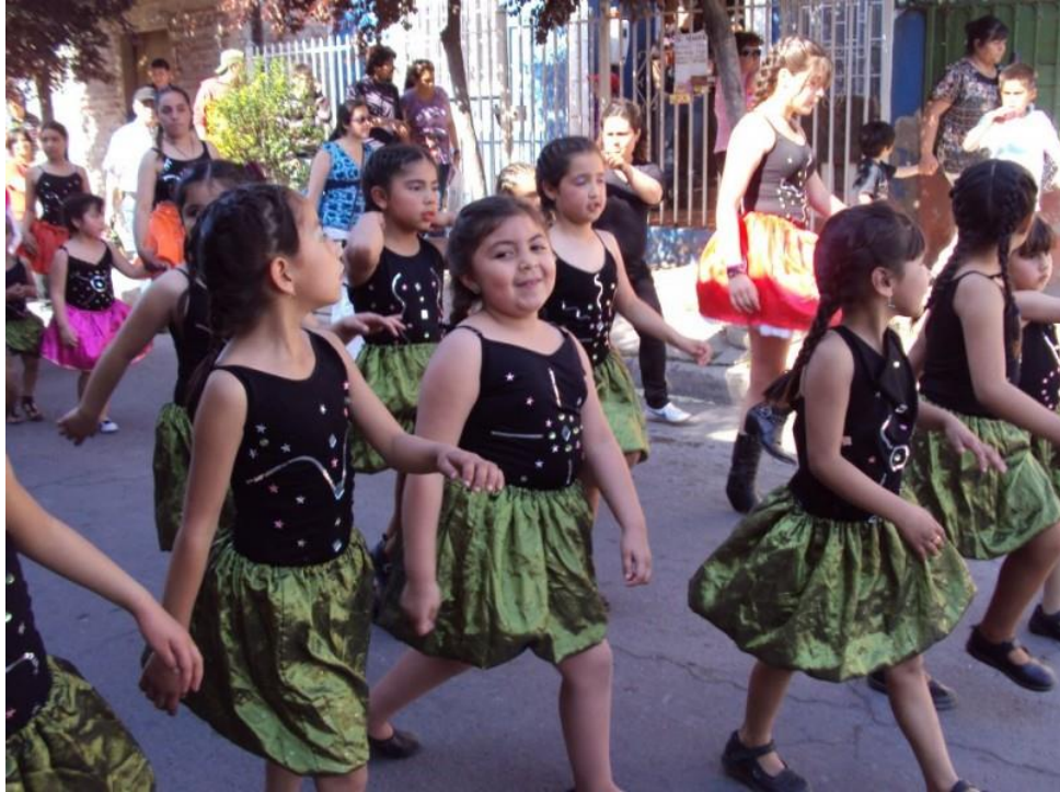
Estudiantes del colegio san Luis Beltrán realizando pasacalles por las poblaciones que rodean al colegio