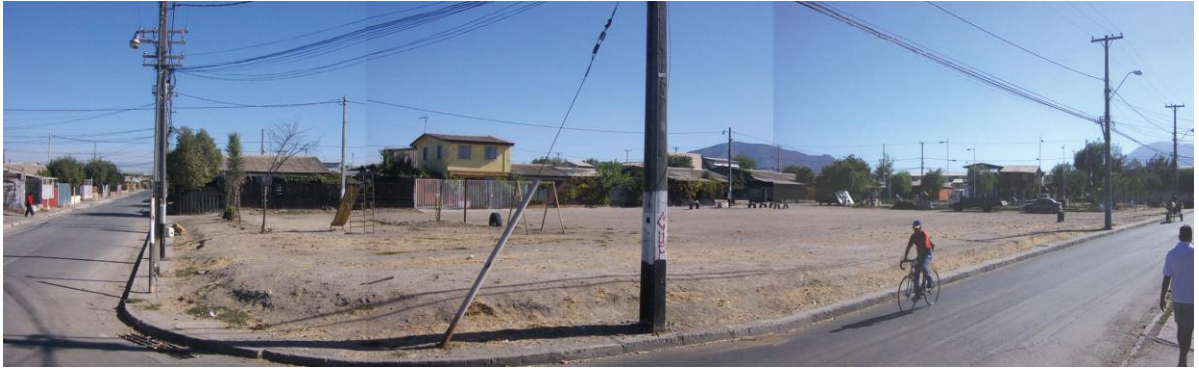
Vista de la antigua cancha de tierra, ubicada en la intersección de las calles, Santa Felicia con Santa Marta.