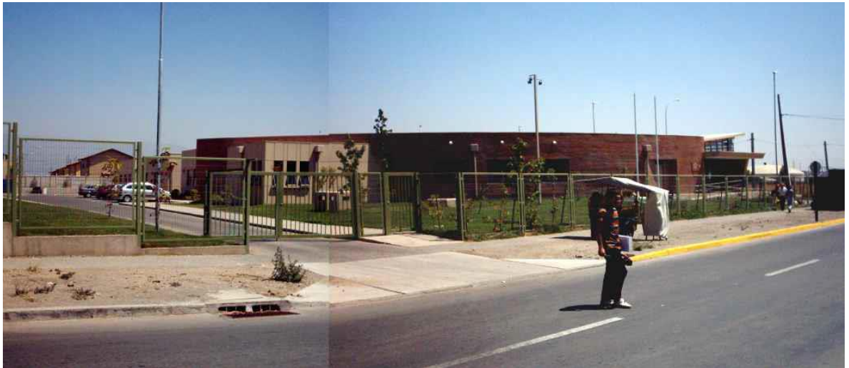
Vista del consultorio Cardenal Raul Silva Henriquez, ubicado en las interseccion de las calles avenida el tranque con Rio Itata.