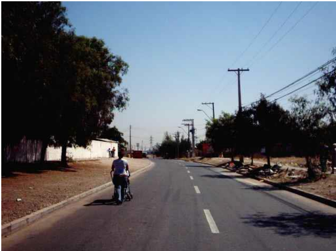
Vista desde Av. el tranque hacia el norte.