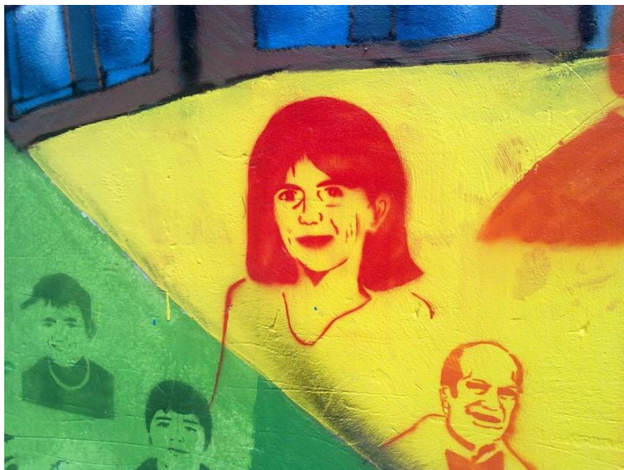
Mural realizado por estudiantes del colegio san Luis Beltrán, donde se muestran los rostros de algunos fundadores del colegio, como Emma Ruiz de Gamboa y el sacerdote jesuita Juan Ochagavía