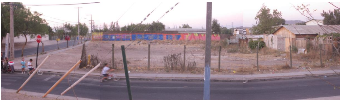
Vista del ex peladero que estaba ubicado entre las calles avenida el tranque y Santa Marta, actualmente allí está construida una población.