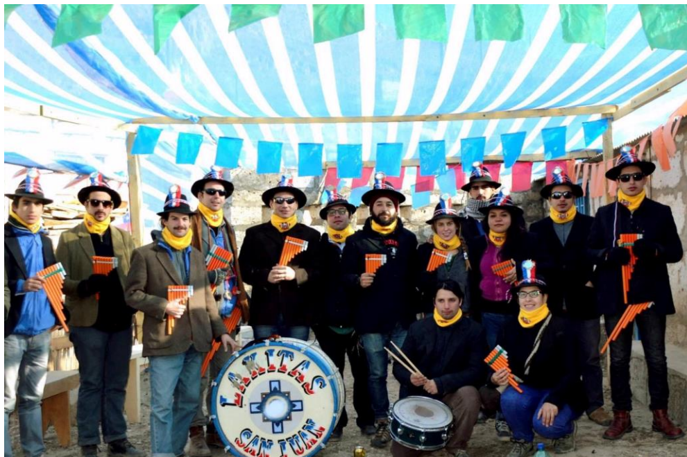
Comparsa “Lakitas de San Juan” en su visita a la fiesta de la Virgen del Carmen en Conchi viejo, Calama, año 2014 8 .

El movimiento andino en el valle del Mapocho se remonta a siglos de historia no registrada en fuentes escritas, por lo cual me remontaré al registro oral que puedo obtener por parte de gente mayor perteneciente a las primeras agrupaciones que se formaron en la segunda mitad del siglo XX en Santiago de Chile. Estas agrupaciones son; Manka Saya, Santiago Marka y Grupo Tun. Junto con esta información también procederé a entrevistar a las personas creadoras de huaynos que participan en comparsas y que practican este ritmo, principalmente comparsas de Lakitas, entre las cuales puedo mencionar a Lakitas de San Juan, Lakitas Apasa, Lakitas Mama Wayra, Lakitas Nuevo Milenio, Lakitas Santa Ana, entre otras.