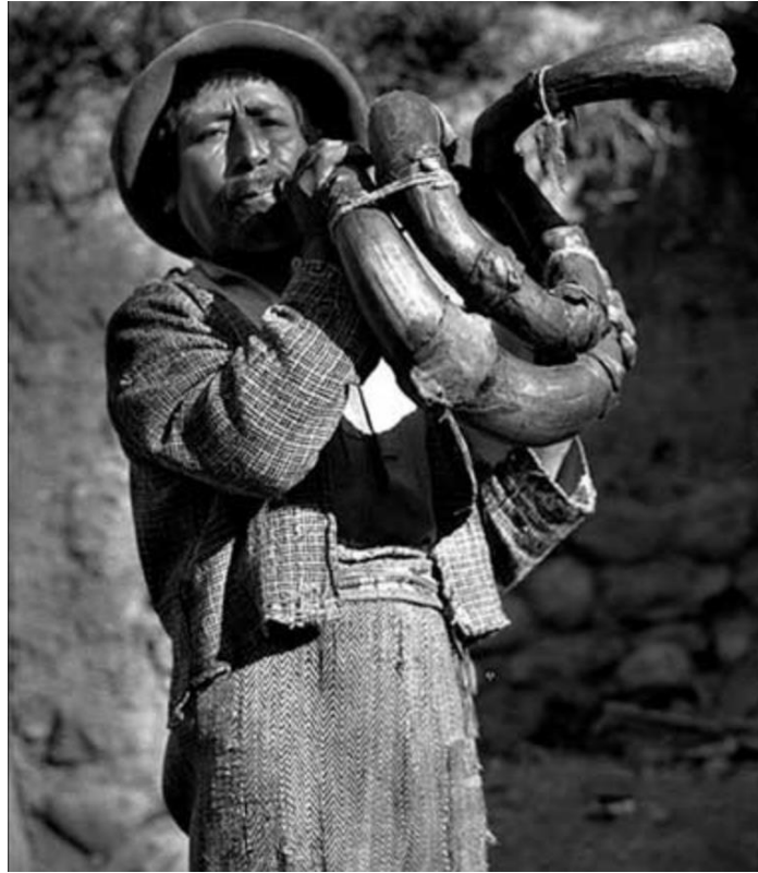
Imagen de un hombre tocando waqrapuco. 12

Un corazón como el mío nunca has de encontrar