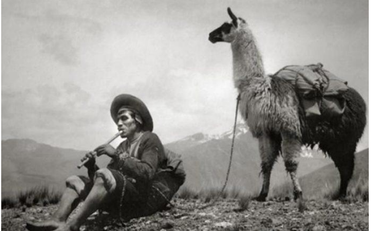
Fotografía de Martín Chambi. Tristeza India 5

Cholo soy y no me compadezcas Que esas son monedas que no valen nada Y que dan los blancos como quien da plata Nosotros los cholos no pedimos nada Pues faltando todo, todo nos alcanza