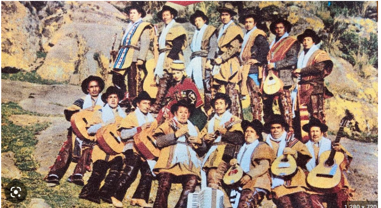
Imagen de la estudiantina Pichicani 7

del huayno como metodología para la enseñanza de instrumentos modernos como el saxofón. Estos dos elementos, uno indígena y el otro occidental, se complementan mutuamente.