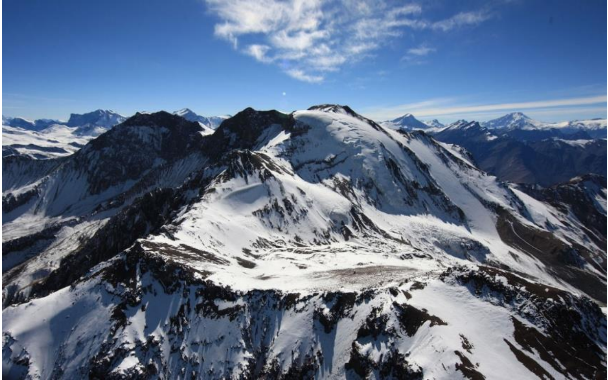
Cerro el Plomo, Apu tutelar del valle del Mapocho 1 .

Soñé que la nieve ardía, soñé que el fuego se helaba