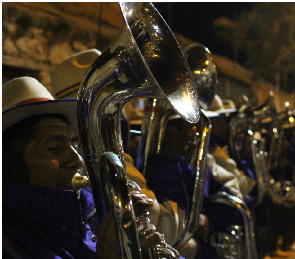
Banda de bronces de la zona andina de Chile 19

Me voy me voy para no volver, palomita me voy me voy