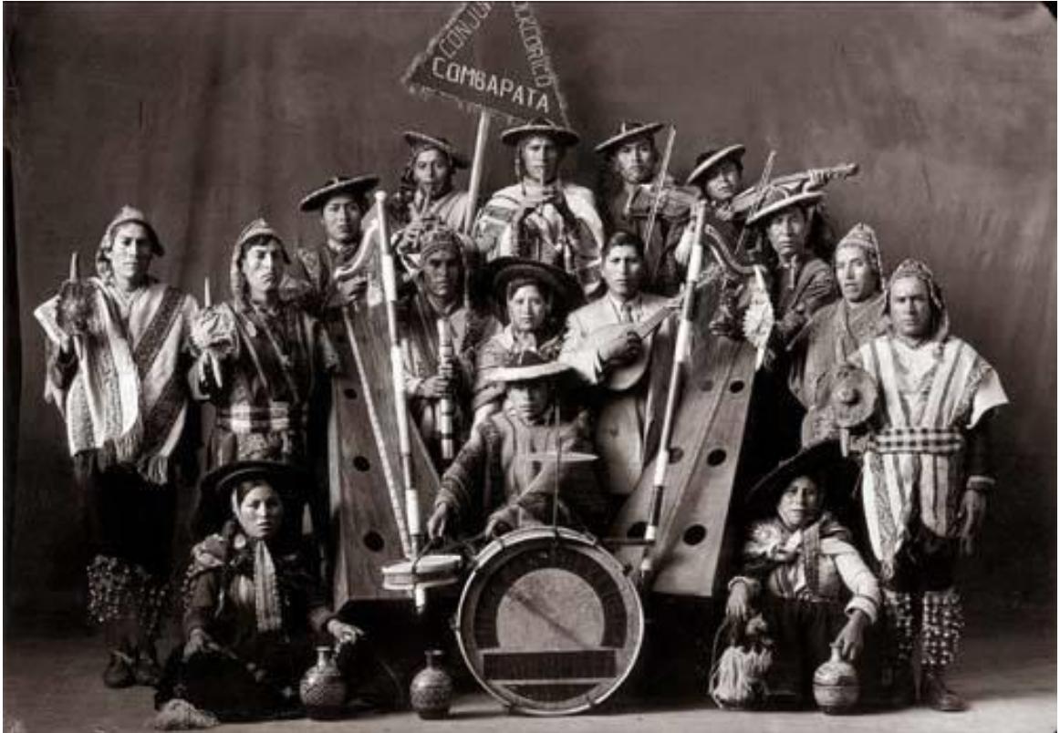
Conjunto Folclórico de Compabata. Martín Chambi 16 .

Los pajarillos del campo pasan su vida cantando