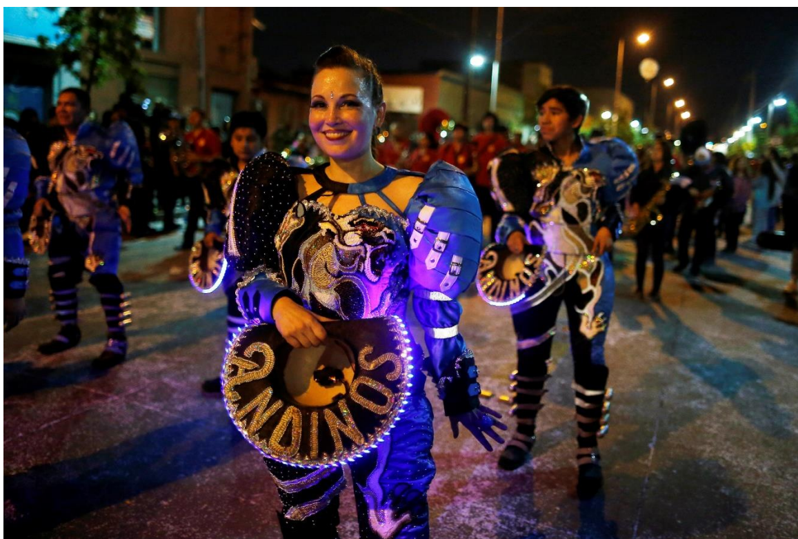
Agrupación de tinku danzando por las calles del barrio Matta sur en Santiago de Chile en 2022 4

Como participante de la comparsa de Lakitas San Juan de la ciudad de Santiago de Chile me he ido dando cuenta de lo activo y vivo que se encuentra el ambiente de “carnavales autogestionados”, siendo estos una de las principales formas de expresión popular en las poblaciones de la capital. Es muy común encontrarse con agrupaciones de Lakitas participando en estos carnavales y más común es que estas comparsas estén tocando huayno.