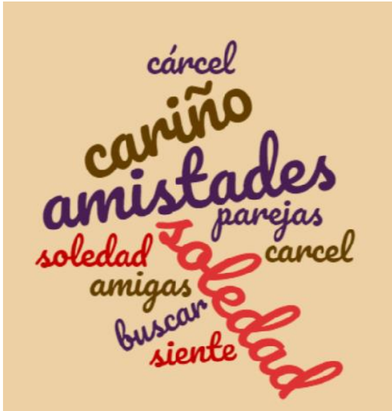
(Cuadro N° 1)

A partir del extracto anterior y de la imagen construida mediante las respuestas de las mujeres entrevistadas, es que se hace importante poder realizar una diferenciación entre el rol de madre que estas mujeres cumplen, con el rol de mujeres dentro de un contexto carcelario.