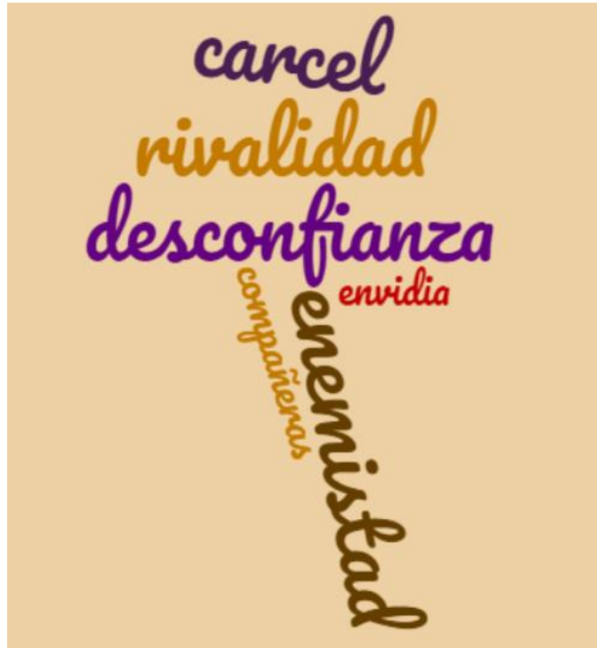
(Cuadro N° 3)

A partir de lo mencionado en este ámbito de privación de libertad, es que al realizar un análisis del discurso en las entrevistas y focus group realizados a las mujeres de esta investigación, por lo cual el recuadro anterior afirmarían la desconfianza y la enemistad que existe en el centro penitenciario femenino a partir de los relatos de las mujeres. Esta enemistad surge a partir de los grupos que se forman dentro del centro penitenciario, grupos que forman rivalidades entre ellos y entre las mujeres, lo cual hace muy cotidiano los enfrentamientos entre ellas.