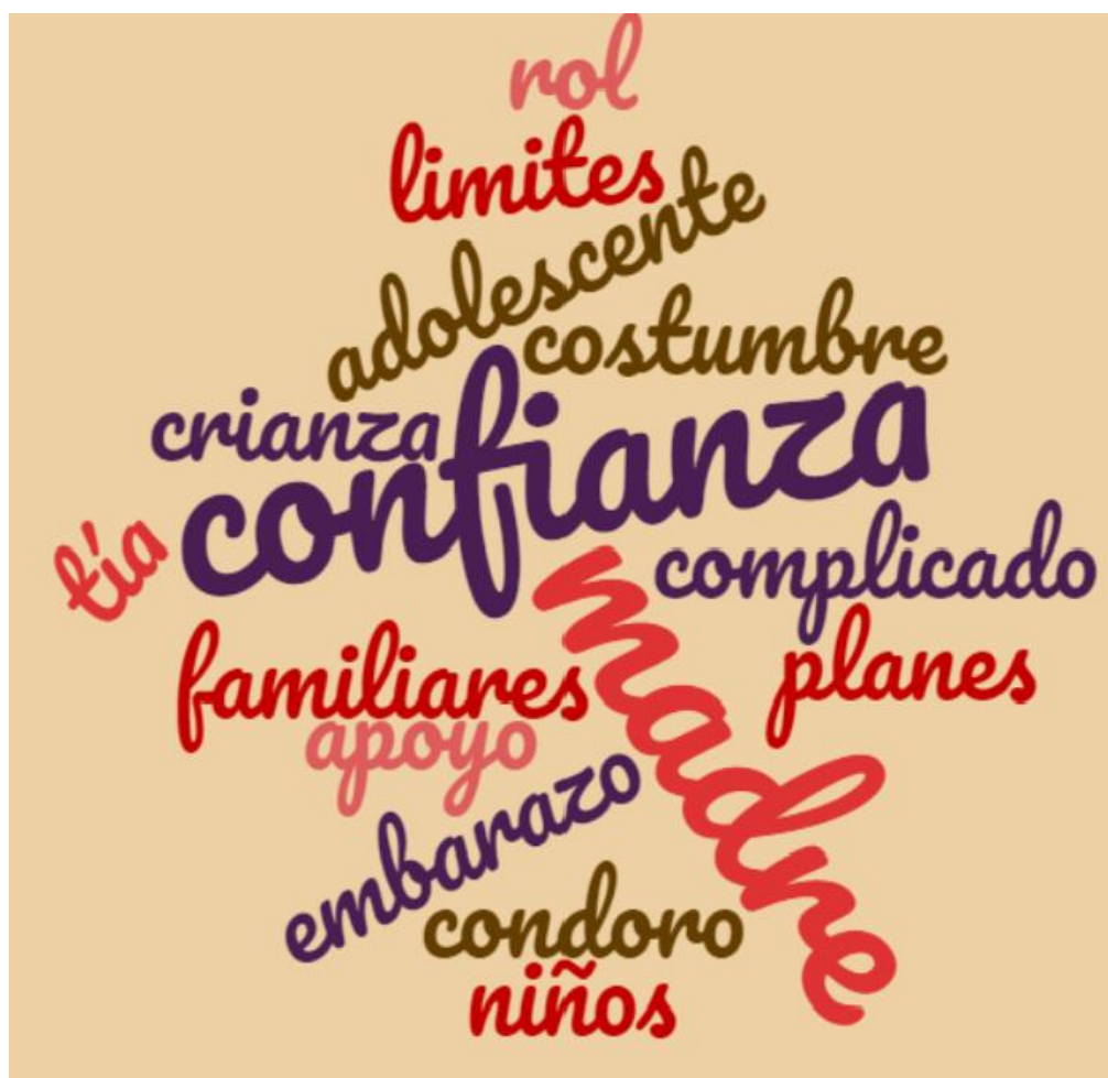
(Cuadro N° 2)

en el hogar de origen), lo cual provoca una pérdida gradual del sentido de pertenencia que el niño o la niña ha desarrollado, así como también en ocasiones la diferenciación de roles en los adultos desencadena en confusión para los niños/as y afecta directamente la relación con la madre.