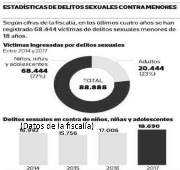
Esquema 1: Estadística de delitos sexuales en contra infanto-juvenil.

La educación sexual previene abusos, principalmente esto es uno de los fundamentos principales, para que los estamentos se logren hacer cargo, por lo cual la integridad se basa en el autoconocimiento de los procesos, pero aprender a identificar abusos y entender o comprender de un posible peligro, logra auxiliar a tiempo.