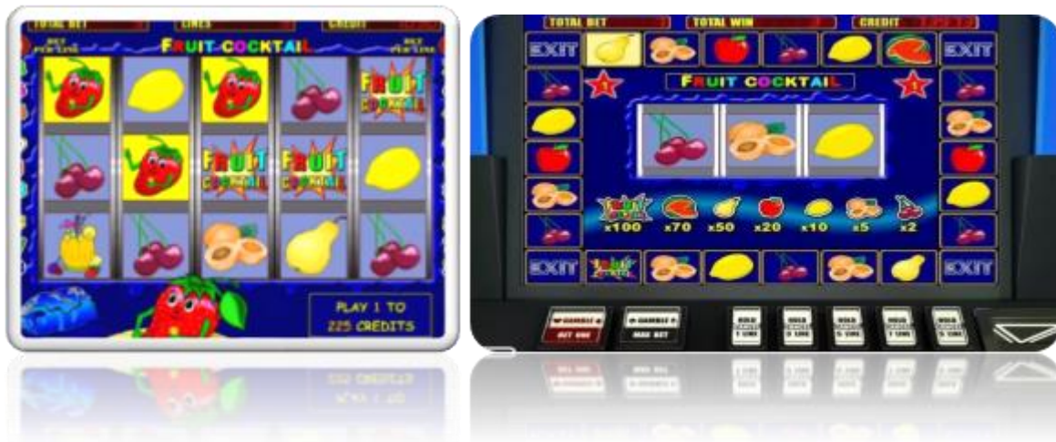
Imagen de referencia tragamonedas 'Fruit Cocktail'

acumulando ganancias tras cada acierto; una vez que el carril del bonus alcanza uno de los cuatro extremos de la pantalla (EXIT) la función se desactiva y el sistema calcula las ganancias del bonus, dichas ganancias se acumulan en el segmento de dinero disponible (CREDIT) y este queda a libre disposición del usuario, quién podría retirarlo o seguir apostándolo.