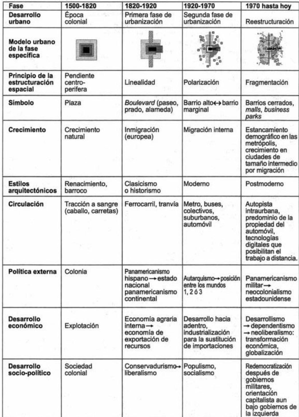
Figura 2. Diagrama sinóptico del desarrollo urbano, político, social y económico en América Latina desde la época colonial hasta hoy .