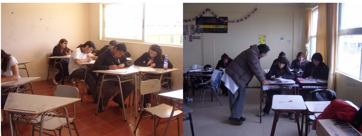
IMAGEN 5: Estudiantes especialidad Humanístico Científica del CESA

En cuanto a las edades de los estudiantes, se puede observar retraso escolar en 8 estudiantes entre 16 y 17 años (11,3%) de 1° medio del C.E.S.A., y en el caso de 4° medio, 5 estudiantes tienen 19 años (9,4%), destacando el establecimiento por tener un porcentaje menor de retraso escolar que el C.G.V., lo que puede deberse a dos situaciones, por una parte la falta de enseñanza media para adultos en el C.G.V. podría estar impactando sobre la determinación institucional del rango de edad permitido para terminar la enseñanza media en el establecimiento; por otra parte, la alta competitividad del establecimiento C.E.S.A. (debida a la capacidad de ofrecer mayor cantidad de especialidades técnicas) podría estar impactando sobre los límites del retraso escolar permitido debido a la alta demanda de las especialidades técnicas en la comuna.