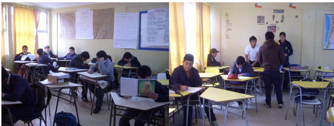
IMAGEN 4: Estudiantes especialidad Técnico Profesional Industrial en Electricidad del CESA

En los recreos los estudiantes se ven tranquilos, la cancha la utilizan para jugar básquetbol, varios conversan sentados. Se pueden diferenciar los estudiantes por especialidades al mirar sus delantales: los T.P.C. Administrativo tienen delantales blancos, los T.P.I. Eléctrico tienen delantales azules, y los humanísticos- científicos llevan delantales a cuadros azules y blancos.