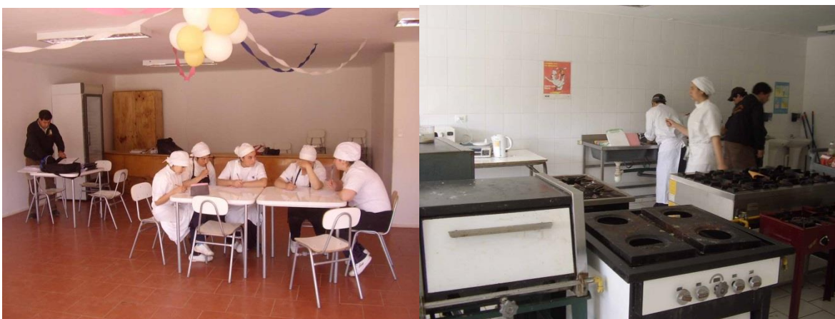
IMAGEN 8: Estudiantes especialidad Técnico Profesional Servicio de Alimentación Colectiva del CGV.

hornos industriales, un mesón metálico grande y dos mesas blanca de madera, sobre los cuales los jóvenes preparan los alimentos; al fondo hay una sala alargada pequeña de bodega donde guardan los implementos de cocina. Detrás de la bodega hay unos baños con camarines independientes para los estudiantes. Uno de los inspectores señala que este año no hay enseñanza media de adultos porque se prefirió concentrar todo en el establecimiento CESA de Ventanas, lo que se debe a la falta de matrícula, que había jóvenes que querían realizarla, pero que eran pocos, y señala que él no sabe más que eso.