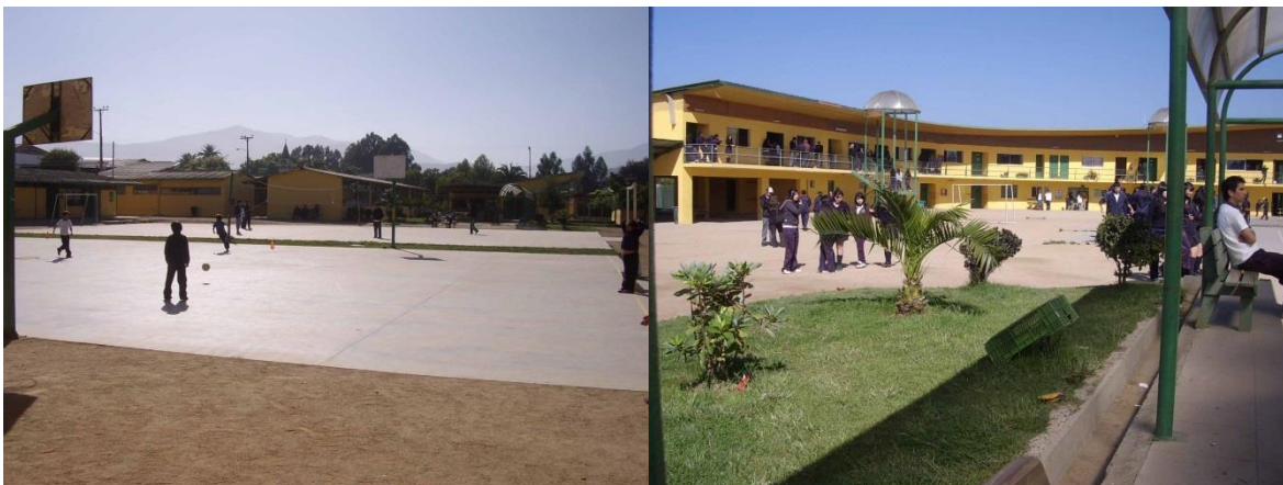
IMAGEN 6: Patio Colegio General José Velázquez Bórquez, localidad Puchuncaví, Comuna Puchuncaví.

características: son aproximadamente de 4 X 6 mt, piso de cerámica, paredes color crema y techo blanco, y ventanas a ambos costados; como implementación sólo hay mesas individuales, sillas y la pizarra de melamina, sin ningún tipo de estante u otro mueble, y las paredes están adornadas con collages de fotos de revistas de mujeres, autos, y personajes de