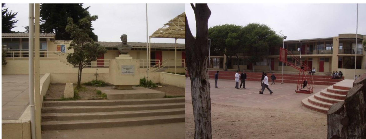
IMAGEN 2: Patio Complejo Educacional Sargento Aldea, localidad Ventanas, Comuna Puchuncaví

A la izquierda se ubican las oficinas del establecimiento y frente a ella, al fondo está la cocina y el casino donde se entregan almuerzos. En el medio se encuentra una hilera de