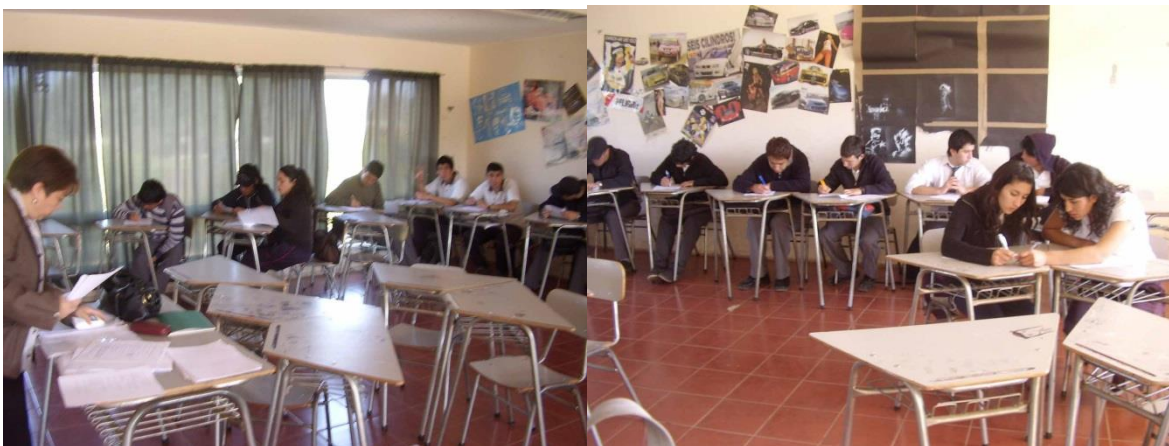
IMAGEN 7: Estudiantes especialidad Humanístico Científica del CGV.

la farándula televisiva. Tiene otra construcción de un solo piso, donde hay cuatro salas para los cursos inferiores.