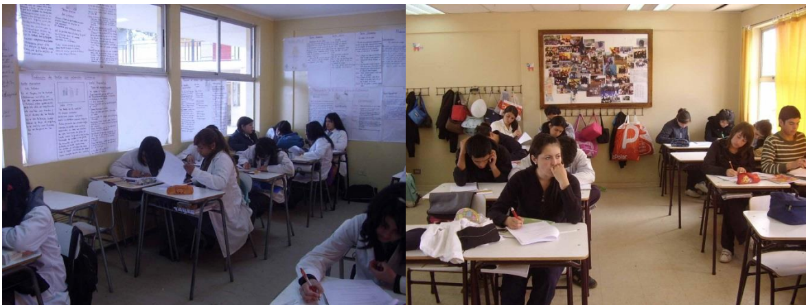
IMAGEN 3: Estudiantes especialidad Técnico Profesional Comercial Administración del CESA

de los de 4° T.P.C. Administración hay un mural donde hay fotos de ellos en distintas actividades dentro y fuera del establecimiento; en la sala del 1° humanístico científico hay recortes de revistas y algunos dibujos; y en la del 4° medio humanístico – científico hay recortes de revistas con modelos solitarias y personajes de la televisión; en la sala del 1° T.P.I. en Electricidad hay papelógrafos de disertaciones, pero desordenados comparados