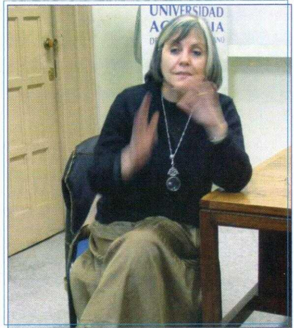
La escritora Diamela Eltit (en la foto), ofreció una charla en la Academia, organizada por el Programa de Género y Sociedad.

La agenda deberá ser entregada al ministerio en octubre próximo.