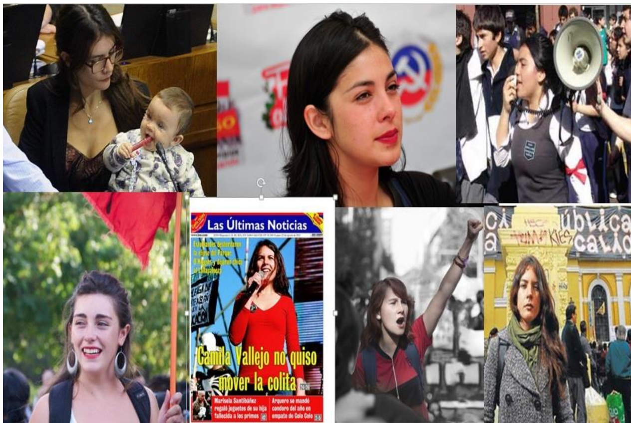
(Imágenes de las figuras íconos del Movimiento Estudiantil chileno, las cuales fueron presentadas a las entrevistadas)