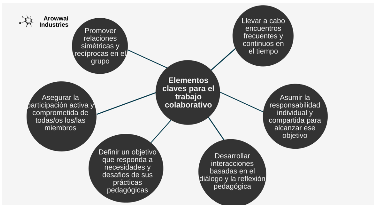
Esquema 1. Elementos claves del trabajo colaborativo, elaboración propia; extraída de Guía trabajo colaborativo Pontificia Universidad Católica de Chile, 2019.

La limitada implementación del trabajo en equipo por parte de los/as docentes proviene de su enseñanza inicial, la cual no los/las incita ni habitúa al trabajo colaborativo, sino que han optado por años en darle principal enfoque a los contenidos, por ello el aprendizaje ha sido de forma mecánica, individual y no significativa.