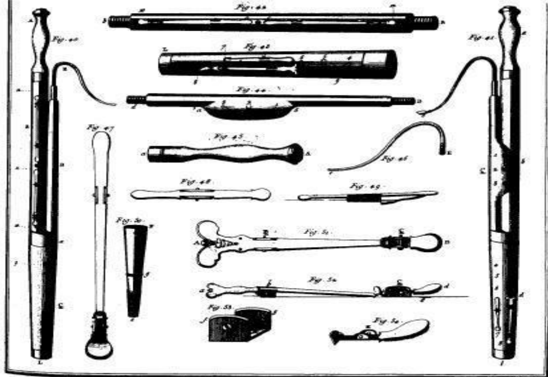
Lutherie, suite des Instruments à vent.