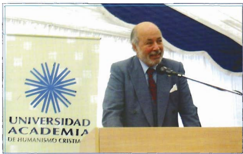
El juez Juan Guzmán durante su intervención.

El ministro de la Corte de Apelaciones de Santiago, Juan Guzmán Tapia, fue la figura principal en el acto de inauguración del año académico 2005 de nuestra Universidad.