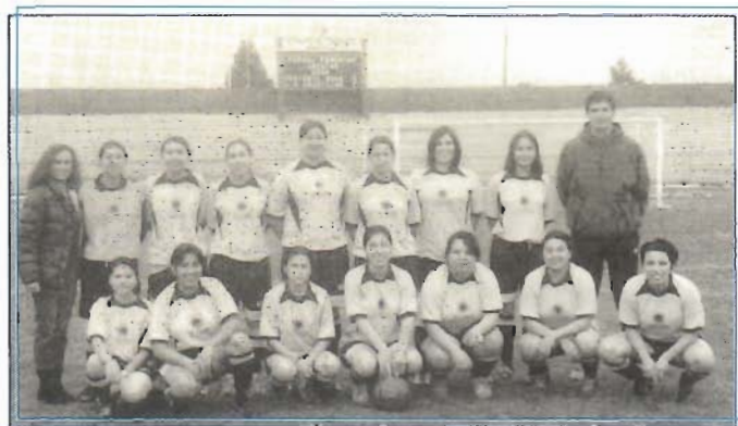
Equipo de fútbol femenino de la Academia, debutó con un triunfo en este 2005.