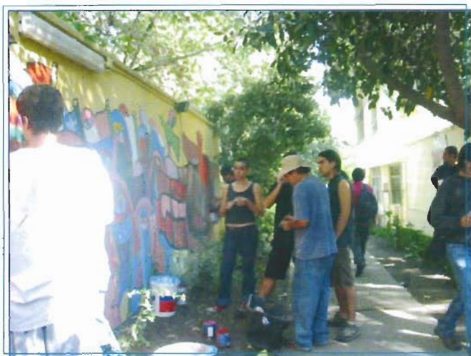
Durante la pintura de un mural, en un patio de la Academia.

En otro orden de cosas, es importante destacar que el equipo femenino de baby fútbol de la Academia jugó su primer partido amistoso del año, venciendo 5 a 3 a un cuadro del Club Deportivo Nuñoa.