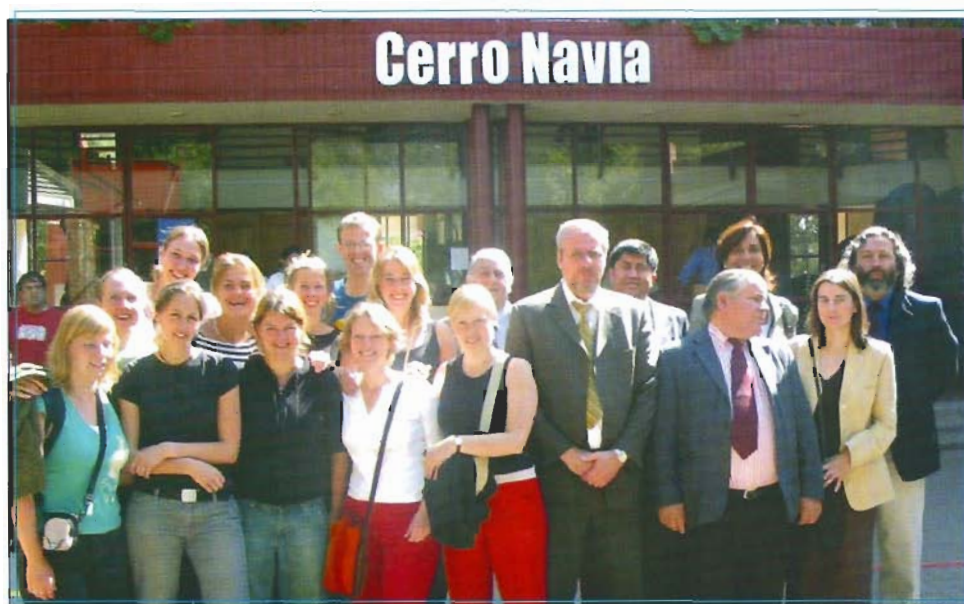
Los estudiantes holandeses y profesores de la Academia, en el frente de la Municipalidad de Cerro Navia, tras la suscripción del acuerdo.