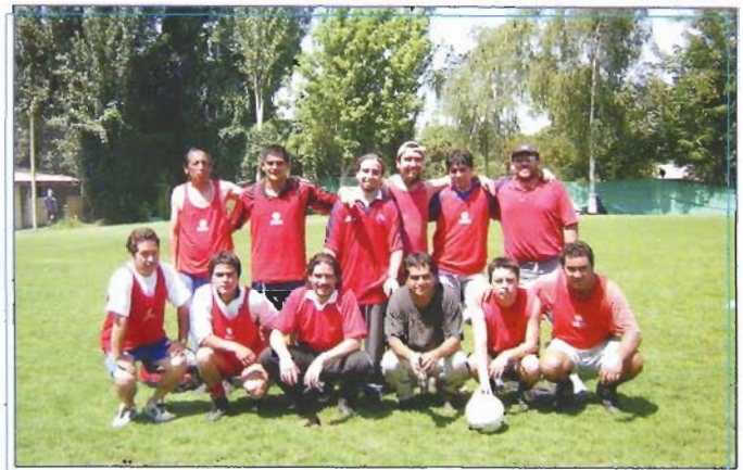
El cuadro triunfador, que sorprendió por su alto nivel técnico.