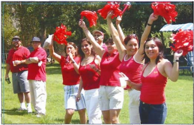
Festean un gol de la "alianza roja" en el partido que ganaron a los azules.

En las fotos, diversos aspectos del paseo.