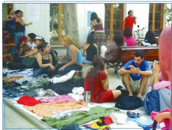
La "feria de las pulgas", al inicio de las actividades estudiantiles en el nuevo año académico.