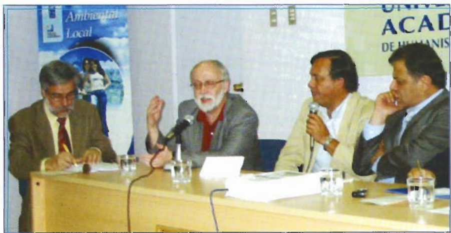
Participantes de uno de los paneles del encuentro.