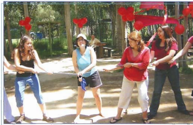
Durante una de las competencias