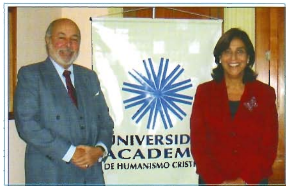
La Rectora y el magistrado Juan Guzmán, poco antes de iniciarse la ceremonia de inauguración del año académico.

Enfatizó que la Universidad mantiene, para todas sus actividades, una política expresa basada en la calidad.