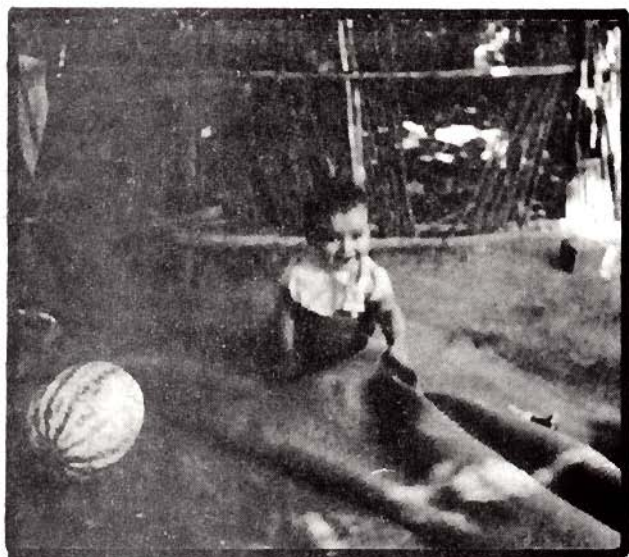
Rinconada de Silva

"Se habló constantemente de los campesinos como lo que no son, los que no viven en las ciudades, los que no saben ..."