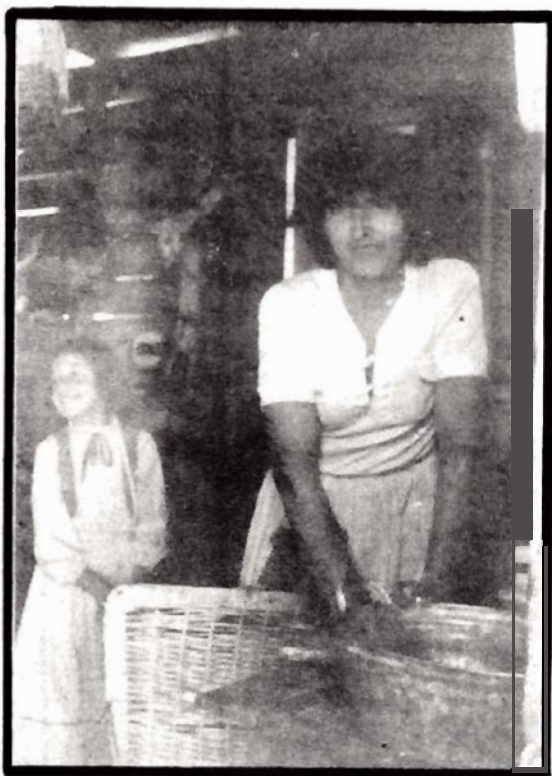
Rinconada de Silva: El trabajo doméstico, otra exigencia para la mujer campesina.