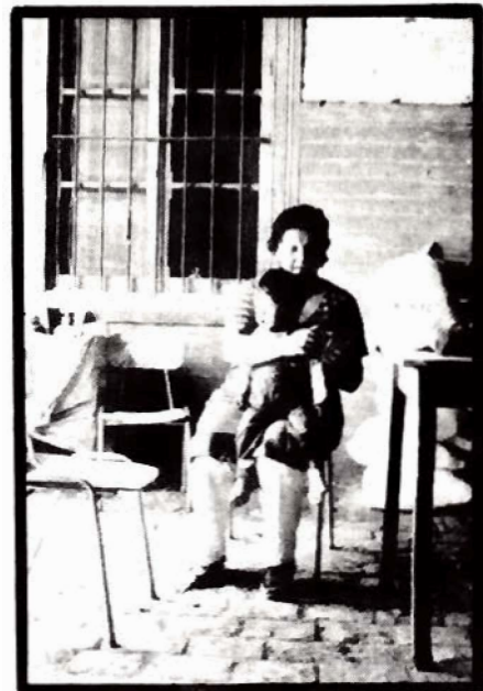
Lo Vicuña: Un aspecto del trabajo de la mujer: el cuidado de los hijos.

La Mujer: "... aparte de la ayuda que proporciona en las labores del campo, debe hacer la comida, lavar los platos, la ropa, regar y barrer el patio ..."