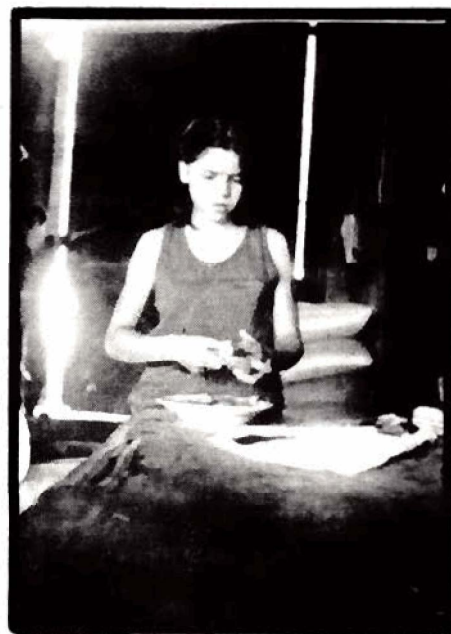
Lo Vicuña: A las hijas se les exige en el trabajo doméstico.