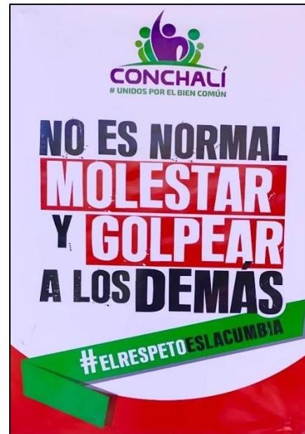
(Imagen N°1)

En el establecimiento educacional la NO discriminación es un punto fundamental en su comunidad escolar de modo que se constituye a partir de la integración de principios como la integración e inclusión (que propende eliminar toda forma de discriminación arbitraria que impida el aprendizaje y participación de los estudiantes), diversidad (que, implica el respeto de las distintas realidades culturales, religiosas y sociales de las familias que, integran la comunidad educativa), cabe destacar que en mis reiteradas visitas al colegio logre apreciar diversos Posters los cuales hacían alusión a la no discriminación (véase imagen 1) a otorgarles información sobre conceptos sobre sexualidad, etc., por otro lado la interculturalidad (el cual exige el reconocimiento y valoración del individuo en su especificidad cultural y de origen considerando su lengua, cosmovisión e historia) y del respeto a la identidad de