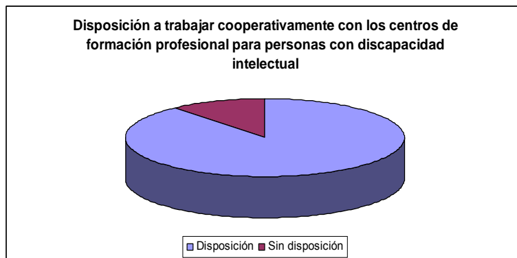
Gráfico N ° 3

Sólo la administradora de la tienda Jokat manifiesta explícitamente que no consideraría realizar alianzas estratégicas entre las escuelas especiales y liceos con formación profesional para recibir alumnos en práctica en su empresa, ya que su experiencia no fue positiva, viéndose esto reflejado en su respuesta; “no, nuestra empresa es pequeña y en realidad la experiencia anterior no fue buena” . Sin embargo al preguntarle, acerca de su disposición de contratar a un alumno en práctica con discapacidad intelectual su respuesta fue positiva; “Sí, dependiendo de las características o el nivel de deficiencia y que en realidad haga un buen trabajo” , lo que deja de manifiesto una contradicción frente a sus argumentos.