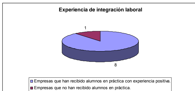
Gráfico N ° 2

Así cualquier tipo de trabajo realizado en sus dependencias fue considerado como una forma de práctica. Sin embargo, el Supermercado Santa Isabel no reconoció el desempeño de un alumno de la escuela especial como una forma de práctica, ya que argumentó; “las personas que trabajan con nosotros son empaquetadores y no se consideran como una práctica” .