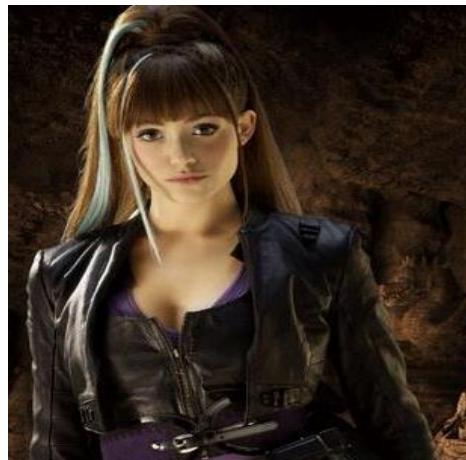
(Izquierda Bulma de Dragon Ball (Anime), 1986, Toei Animation; Derecha Bulma de Dragon Ball Evolution (Película), 2009, 20th Century Fox)