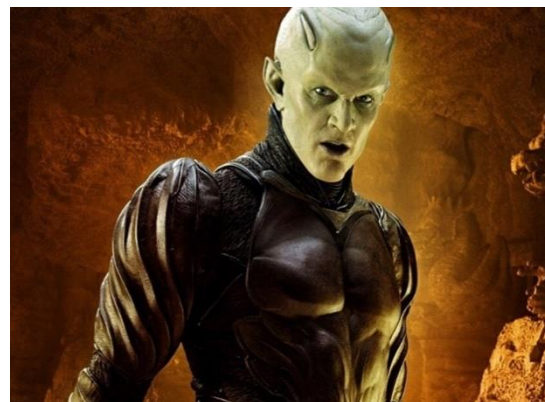
(Izquierda Piccolo de Dragon Ball (Anime), 1986, Toei Animation ; Derecha Piccolo de Dragon Ball Evolution (Película), 2009, 20th Century Fox)