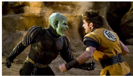
( Izquierda Goku vs Piccolo de Dragon Ball (Anime), 1986, Toei Animation ; Derecha Goku vs Piccolo de Dragon Ball Evolution (Película), 2009, 20th Century Fox)

Otra diferencia que podemos observar es que el pantalón que utiliza el personaje de la derecha es de un color azul oscuro, a diferencia del naranja que presenta el Goku del anime. Estos cambios en las paletas de colores son las decisiones que toman los fotógrafos, tal como mencionaba Salkeld (2016).