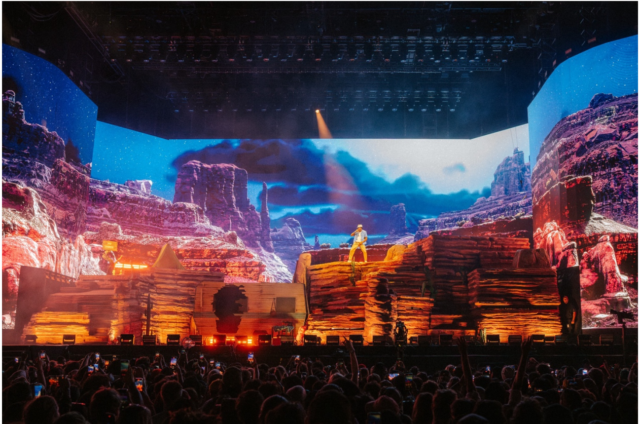
Nota. Presentación Call Me If You Get Lost , Coachella. Tomada de Highlights 2024: Weekend 1, Saturday. [Fotografía]. Coachella, 2024 ( https://www.facebook.com/photo/?fbid=967617048045822&set=pcb.967621141378746 ).