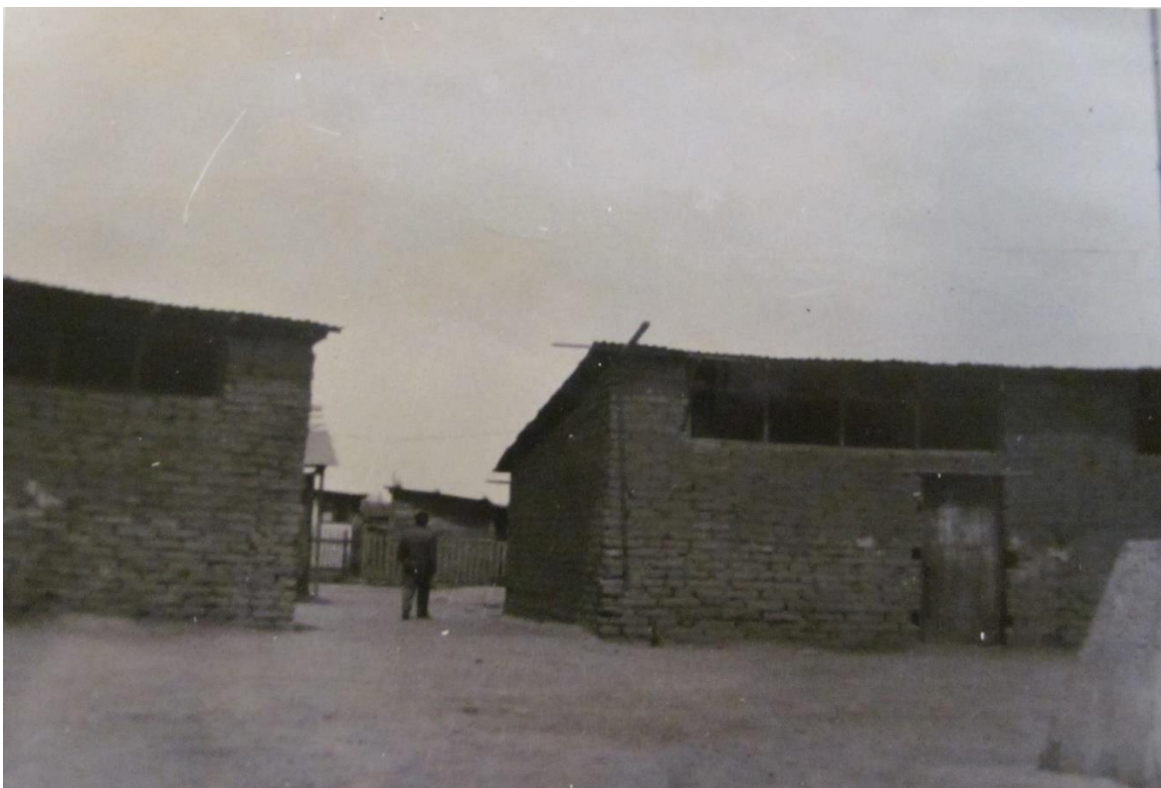
Imagen 5: Escuela redonda en su interior

Sin embargo, esta etapa fue transitoria, pues de manera paralela los vecinos de La Victoria habían iniciado la búsqueda de profesores que asumieran estas tareas profesionalmente. Como señalan algunos testimonios, en esta misión fueron muy importantes las redes de los militantes comunistas, quienes consiguieron que un joven profesor, oriundo de Curicó, viajara hasta Santiago para convertirse en el primer docente profesional de la escuela. 22 La escuela no sólo fue importante para la educación de los pobladores, sino que también para el cuidado de los niños, el Comando se comprometería a financiar una parte de los gastos de la escuela siendo esto beneficioso para las familias más pobres del campamento ya que muchas no tenían suficientes recursos para poder alimentar a sus hijos.