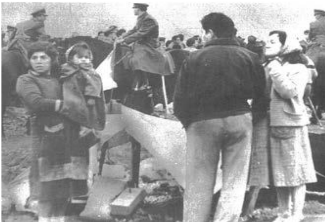
Imagen 2. La toma de La Victoria, 1957, enfrentamiento con los carabineros

pasando las horas. Carabineros comenzarían a desalojar en un principio de manera violenta pero los pobladores por su parte comenzaron a defenderse y a negarse a abandonar el lugar. Los argumentos de las autoridades en primer lugar se referían a la ilegalidad de la toma debido a que esos terrenos no les pertenecían, sumado a esto, buscaron también ilegitimarla mencionando que la toma era incitada por agitadores políticos y finalmente que la concentración de personas podía ser un potencial foco de epidemias, por lo que era de suma importancia repelerlas.