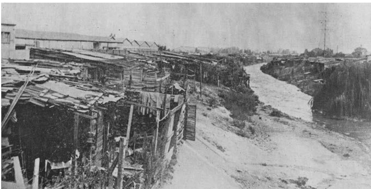
Imagen 1. Poblaciones callampas.

La pobreza y un estado ausente provocó que estas poblaciones del “Cordón de la Miseria” comenzaron a organizarse de manera activa con ciertos partidos políticos de izquierda, principalmente el partido socialista y el partido comunista, siendo este último ilegal debido a la ley de la defensa permanente de la democracia conocida popularmente como “Ley Maldita” aprobada en el año 48’ en el gobierno de Gabriel González Videla. Esta ley ilegaliza al Partido Comunista borrando de los registros electorales de todos sus militantes. En 1956, debido a la persecución política contra la izquierda chilena y principalmente las ideas marxistas provocaron que los ya mencionados partidos políticos se reunieran y fraternizaran por la defensa de la izquierda política, dando creación al “Frente de Acción Popular” (FRAP) una coalición de distintos partidos de izquierda que buscaban rearmar la política izquierdista junto a las grandes masas populares. En la clandestinidad el partido comunista comienza a acercarse y a prestar apoyo a estas poblaciones más desposeídas, por lo que la organización poblacional comenzó cada vez más a sentar sus bases por la lucha de una vivienda propia.