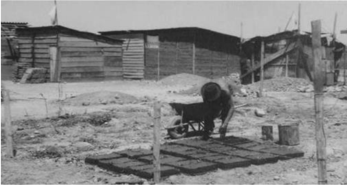
Imagen 4: Un poblador fabricando adobes

conseguíamos en la pesebrera del Club Hípico. Las señoras se conseguían la paja, los jóvenes hacían los adobes y los maestros los pegaban. Se fue formando la escuela, que tenía una curiosa arquitectura: era redonda. Realmente merecen un homenaje los profesores que en esas aulas hicieron sus clases, porque demostraron que creían en nosotros. 20