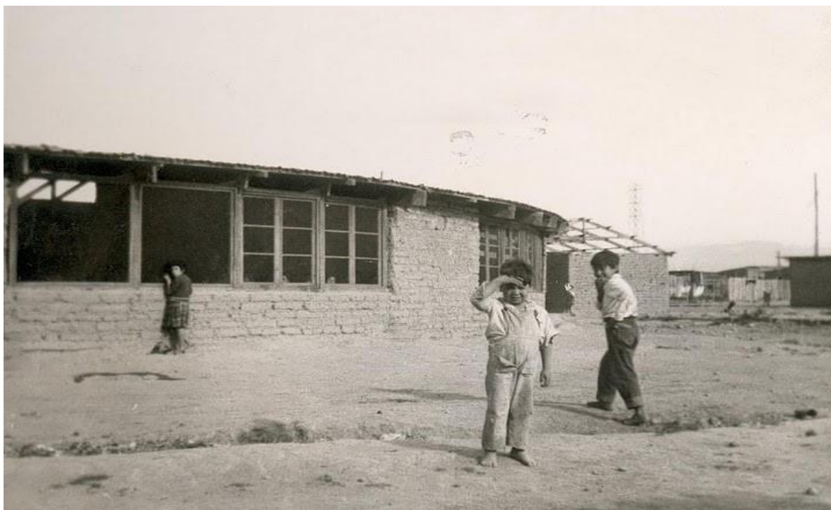
Imagen 4: “Escuela de La Victoria”, (fuente: S. Tabilo, 1958)

se terminaba de construir por completo, pero, aun así, la escuela comenzaría sus funciones albergando a más de 1000 niños. Esta escuela fue completamente construida y administrada por la comunidad, no estar constituida por los parámetros arquitectónicos y educativos que exigía el estado significaba que no recibirían ayuda alguna por parte de este, por lo que el proyecto se llevaría a cabo bajo la solidaridad y voluntad de los vecinos.