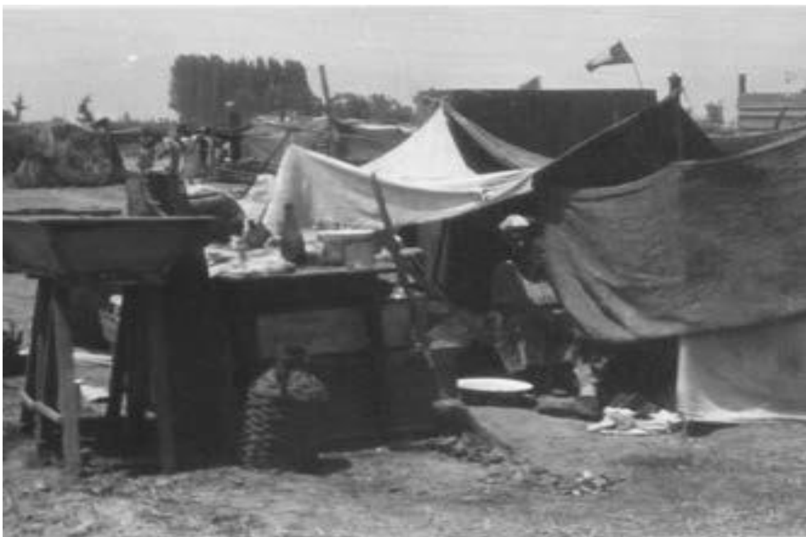
Imagen 3. El asentamiento durante los primeros días (fuente: Sotomayor, 1958).

poder ubicar a todas las familias de manera equitativa. Al principio, la organización se llamaba Comando. El Comando, estaba compuesto por un grupo de compañeros más intelectuales y con mayor conocimiento para tomas de terrenos y dirigir una organización de pobladores. 16 Esta organización se desarrolló desde el primer día en que llegaron y fue crucial para comenzar con una planificación más ordenada de la toma. Quienes pertenecieron al Comando, solicitaron ayuda a estudiantes de arquitectura de la Universidad Católica y Universidad de Chile, quienes acudieron al llamado siendo los principales guías de la urbanización del sector.