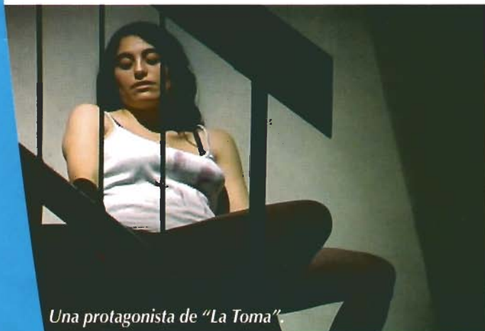
Una protagonista de "La Toma"

Para los interesados en aportar en las actividades de "La Tribu", acercarse al DAE de la Universidad.