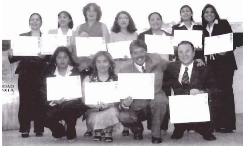
FLAMANTES TITULADOS. - Once titulados como ingenieros en Gestión Pública exhiben orgullosos sus diplomas.

De la Escuela de Ingeniería en Gestión Pública se titularon 114 alumnos; de Psicología y Trabajo Social, 35 estudiantes en cada una; 18 de Ciencias Políticas; 14 de Periodismo; 5 de Sociología; 5 de Contador Auditor; 3 de Antropología y 3 de Ingeniería Comercial.