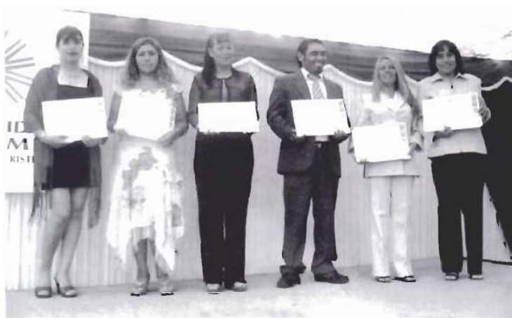
SEIS TITULADOS. - Seis alumnos y alumnas-profesores, titulados del Programa de Formación Continua, exhiben sus diplomas en una ceremonia efectuada en enero en la sede de nuestra Universidad.

Si pensamos que los profesores que han transitado por la Academia se desempeñan, en su mayoría, en colegios municipales de sectores carenciados cultural y