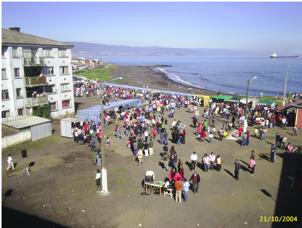
Día de Schwagger. Sector Puchoco