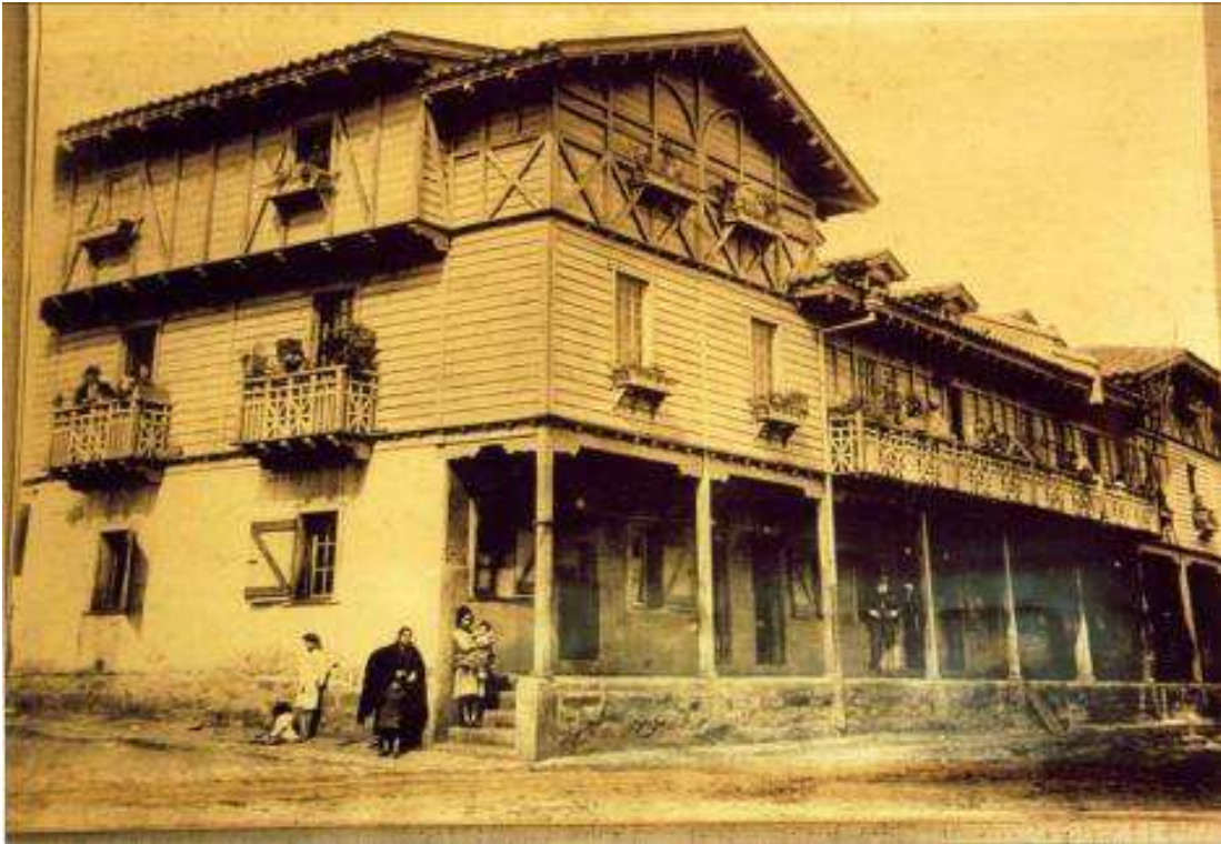
Pabellón 83. Barrio Fundición de Lota (Foto de época)