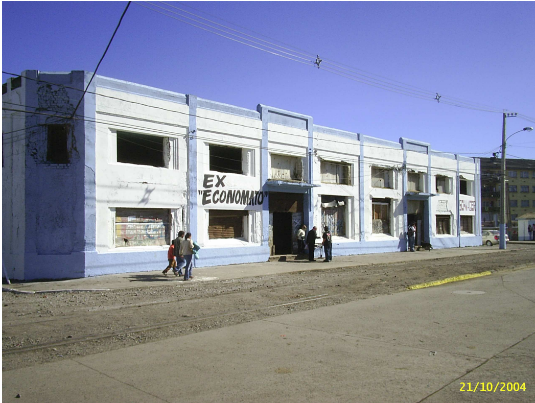
Economato. Antiguo Mercado de la Empresa, en Puchoco, Coronel