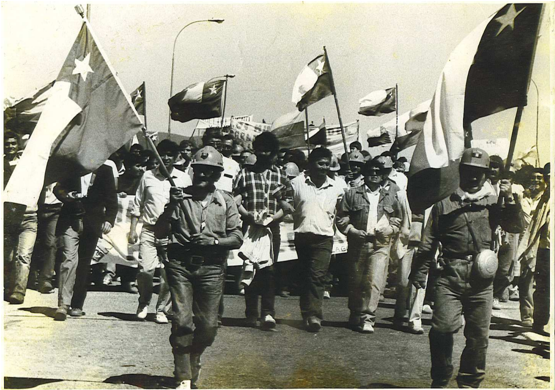
Huelga de 1960, marcha de los mineros a Concepción