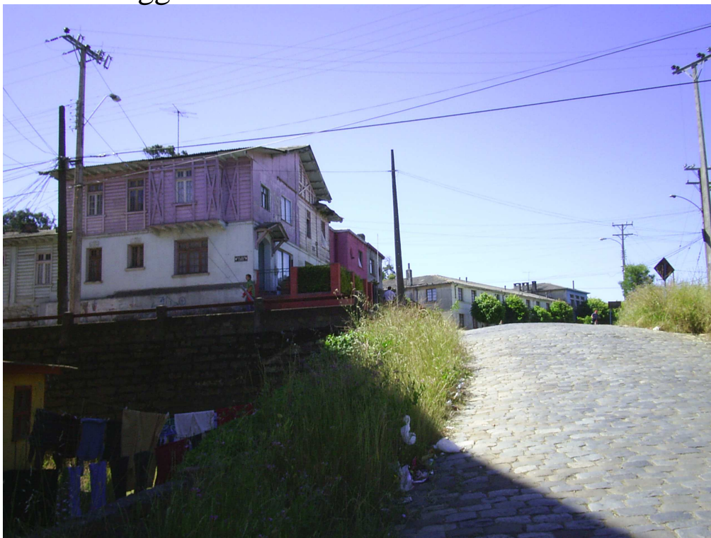
Pabellón en barrio Fundición de Lota