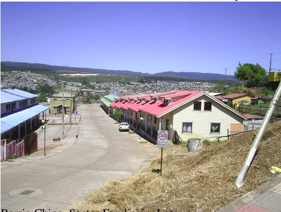
Barrio Chino. Sector Fundición. Lota