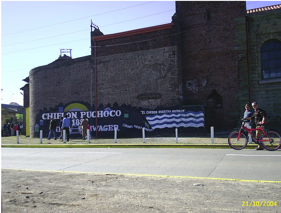
Chiflón Puchoco, hoy museo, durante el Día de Schwagger (Agosto de 2006, Coronel, Barrio Puchoco)