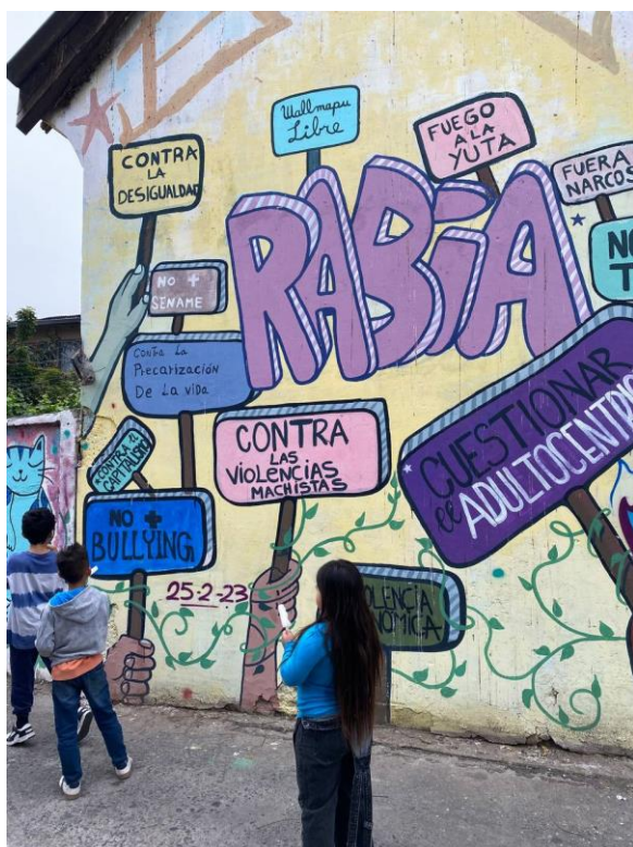
Ilustración 3: Foto tomada por un compañerx de “Aurora Negra” el día 23 de octubre en un mural de la población la Legua.

En definitiva, la experiencia de Aurora Negra en La Legua no solo refleja la evolución de una organización educativa, sino también la intersección de la resistencia histórica, los desafíos actuales y las dinámicas complejas del territorio. La búsqueda de la libertad y la construcción de alternativas educativas en contextos oprimidos resaltan la importancia de entender y trabajar desde las realidades particulares de cada comunidad. Este análisis proporciona una base valiosa para explorar más a fondo la interacción entre pedagogías libertarias, investigación-acción participativa y la realidad sociopolítica de La Legua en el contexto de la educación.