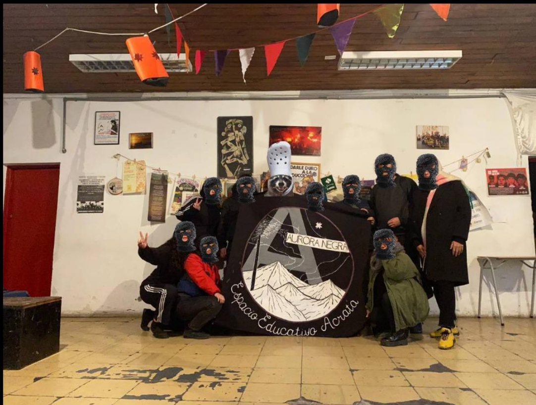
Ilustración 5: foto tomada por un compañerx de "Aurora Negra"