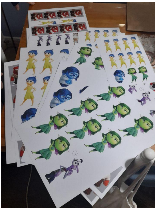
Ilustración 2:  el día 17 de agosto del 2023

El juego aborda el lenguaje corporal y expresión viso gestual, para llevar las emociones a las expresiones corporales en un trabajo colectivo.