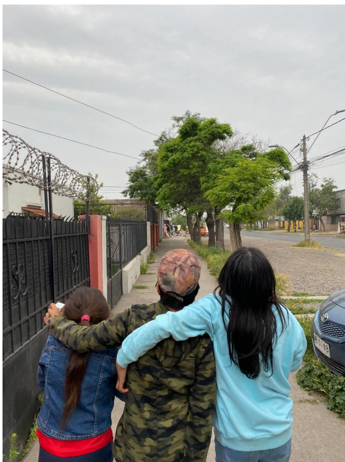
Ilustración 4: Foto tomada por un compañerx de “Aurora Negra” el día 23 de octubre en el carnaval de la revuelta

En conclusión, la relación entre el espacio educativo ácrata Aurora Negra y el Estado se caracteriza por su inexistencia. Mientras algunos/as/es buscan mantener una distancia radical, como en el caso de Aurora Negra, otros exploran tácticas selectivas de colaboración, aprovechando de alguna manera los recursos. La pedagogía libertaria persiste como una fuerza desafiante de las normas educativas convencionales, promoviendo una reflexión constante sobre la naturaleza de la educación y la autoridad en la sociedad. En este proceso, estos espacios se convierten no solo en lugares de aprendizaje, sino también en manifestaciones prácticas de resistencia y construcción de alternativas educativas emancipadoras.