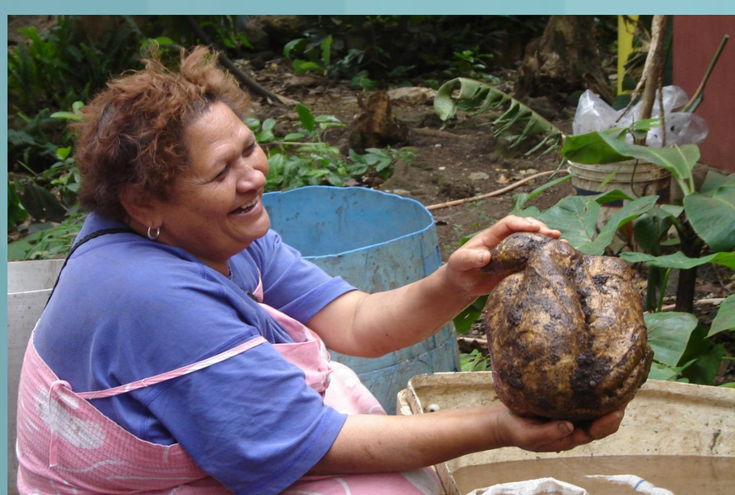
Formas tradicionales de producción y extracción

La abundancia de alimentos, especialmente en los grandes festines fue y sigue siendo parte importante del ordenamiento cultural en la tradición de Oceanía y Rapa Nui. Kai , hace referencia a la acción de comer y a la comida en sí, tanto crudos como cocidos. Son parte fundamental en los compromisos y obligaciones ceremoniales incurridas por una persona o grupo familiar en especial si son parte de la familia extensa (del kainga ). El intercambio, presentación o distribución de alimentos más allá de su perspectiva económica, posee valores relacionales y subjetivos que permiten la permanencia de los lazos sociales. La mayoría de las ceremonias antiguas tenían como eje central el umu (curanto). El umu actúa como transformador de alimentos desde su estado de naturaleza a un estado para el consumo cultural; los conserva, distribuye y con ello congrega a la comunidad en torno a él con fines sociales o religiosos.