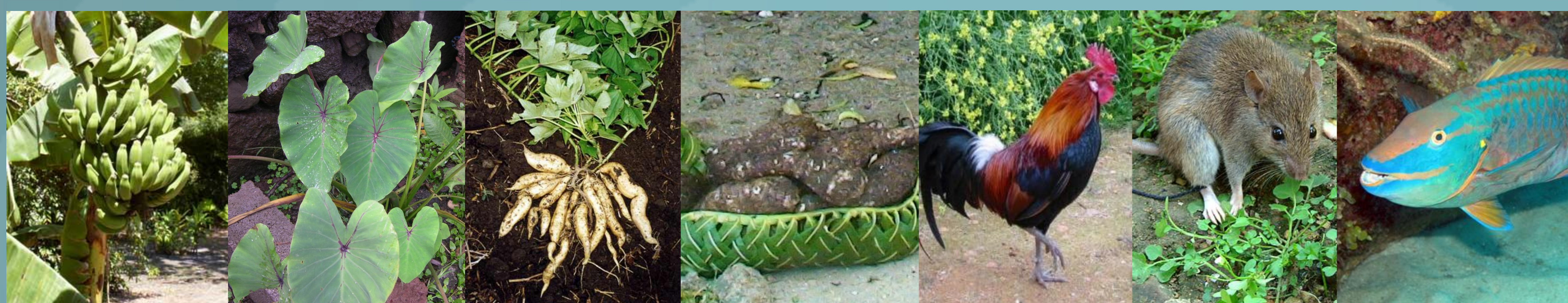
Los tubérculos y frutas : taro, camote, ñame, plátanos, bananos