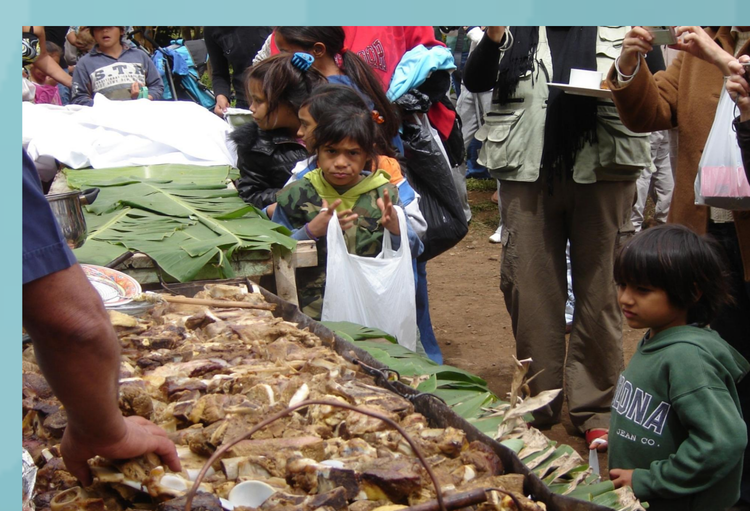
Formas tradicionales de distribución