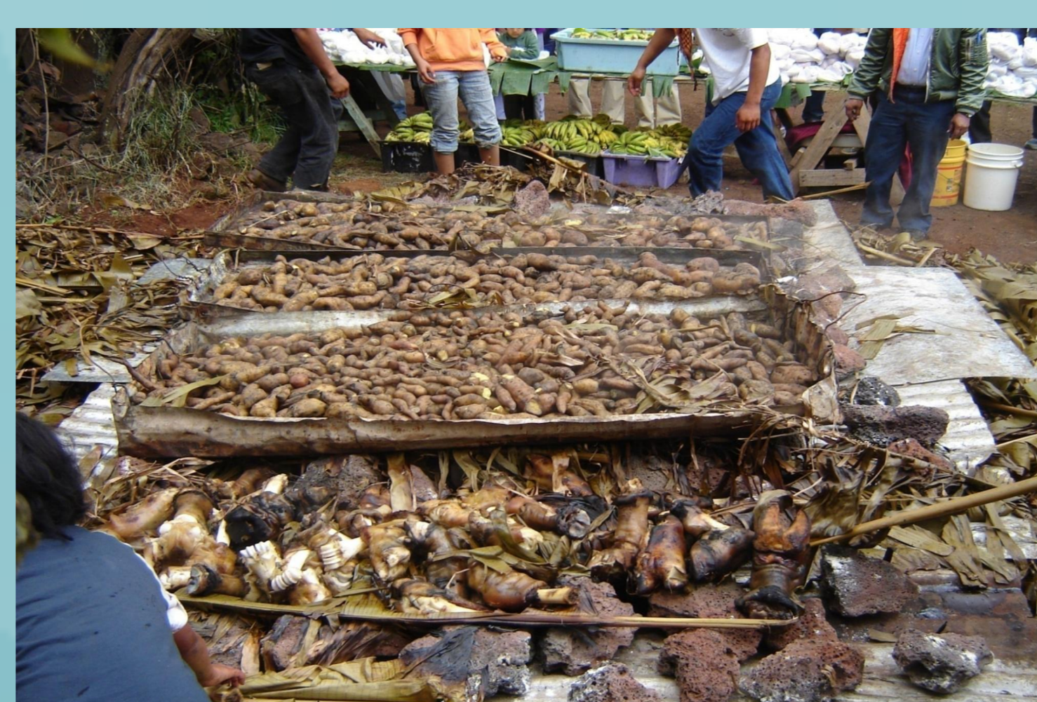
Formas tradicionales de preparación