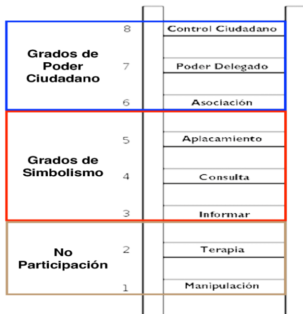
Figura 1: Identificación del COSOC y su participación consultiva