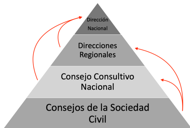
Figura 4: Pirámide de comunicación entre los Consejos de Sociedad Civil, Consejo Consultivo Nacional, Direcciones Regionales y Dirección Nacional.