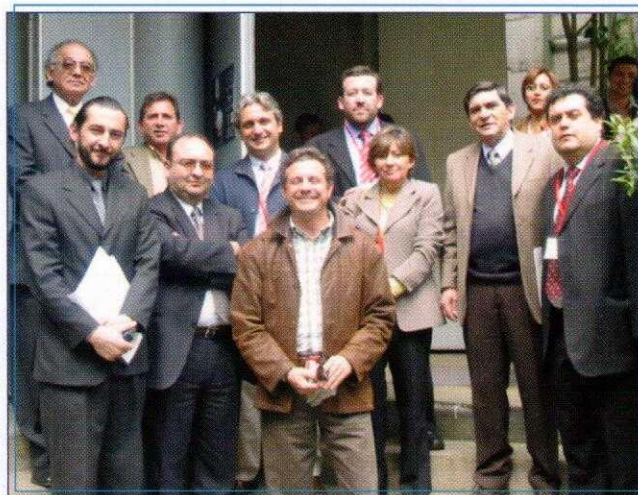
COMITÉ ORGANIZADOR Parte de los organizadores del encuentro internacional.

Las terceras Jornadas Internacionales de Mediación y Familia se llevarán a cabo en octubre del 2006.