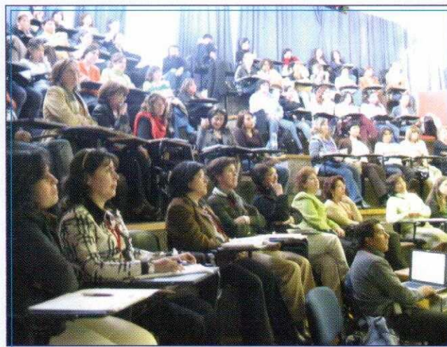
INTERES Vista de una de las tantas reuniones efectuadas durante el encuentro.