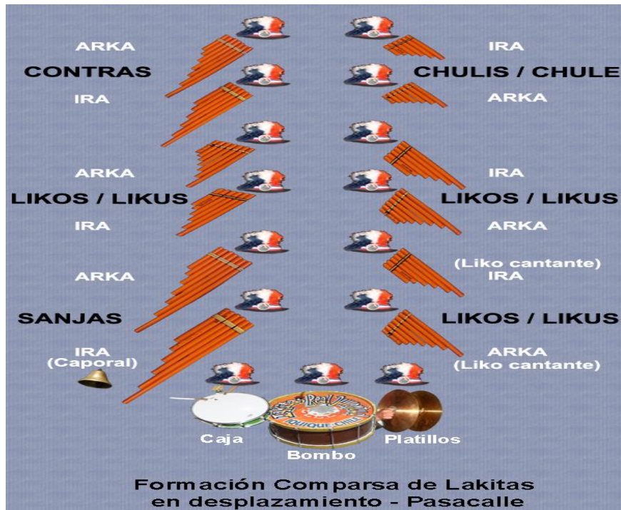
Figura 5. Formación de comparsa de lakitas. www.lakitasdetarapaca.cl

La ejecución musical del género lakitas contempla diversos ritmos musicales ligados a los procesos de modernización abarcando huayños, morenadas, huaylas, takiraris, tobas, diabladas hasta cumbias, por lo tanto “ Su repertorio típico incluye danzas y melodías tradicionales del altiplano andino (huayños, takiraris, morenadas), del folclore (cuecas vases) y de uso ceremonial ” (Vernal y Muñoz, 2013: 8)