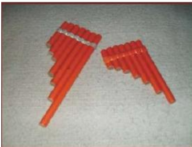
Figura 2. Par de lakitas. Vernal y Barros, 2013.

“La organización tonal corresponde a una escala diatónica, usualmente Sol o Do, dispuesta en forma intercalada y complementaria entre ambas hileras, conocidas como “primera” o “ira” y “segunda” o “arca”. (Vernal y Muñoz, 2013: 19) por lo que la estructura del instrumento tiene forma de escalera como se muestra en la siguiente imagen.