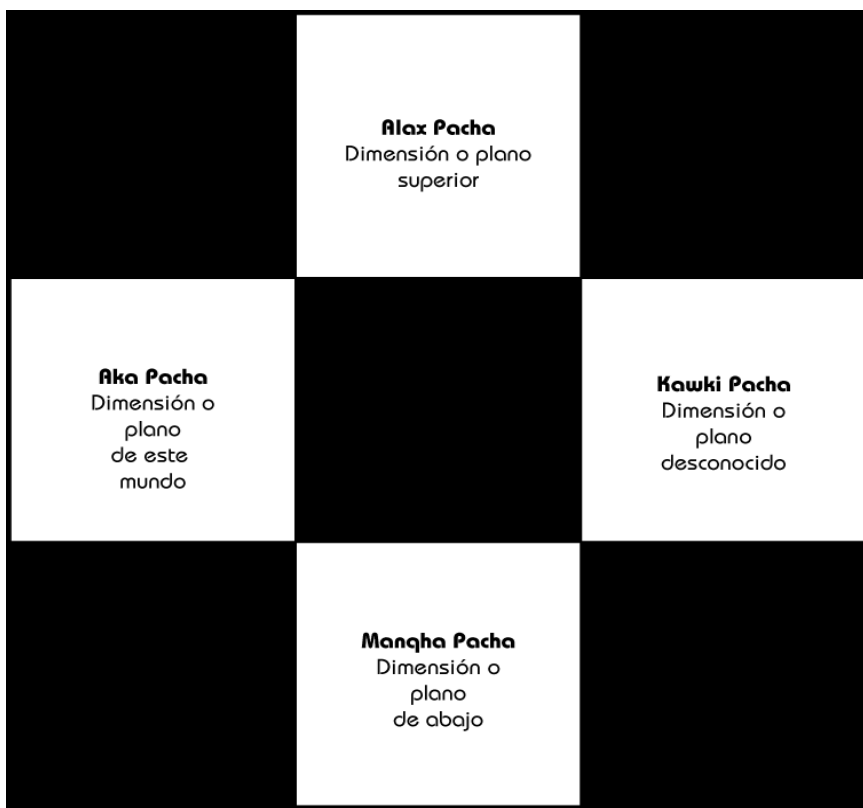
Figura 1. Planos de la cosmovisión aymara. Huanacuni, 2010

En base a lo anteriormente planteado y considerando a Huanacuni (2010) el mundo desde una visión andina se expresa de la siguiente forma: