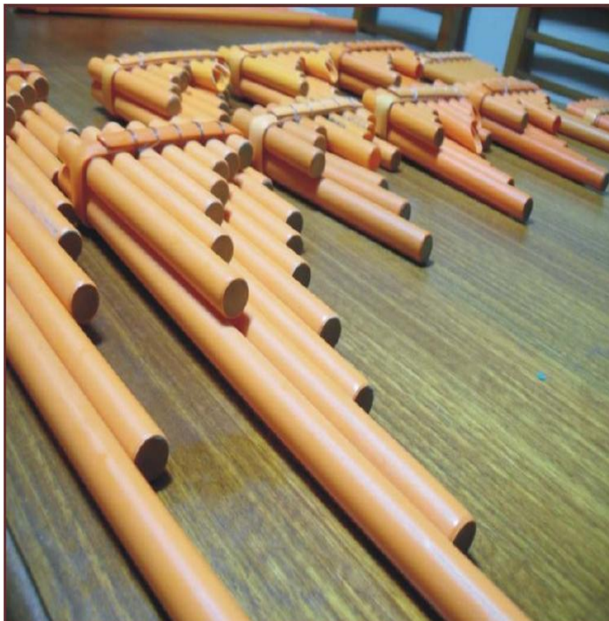
Figura 3. Tropa de lakitas. Vernal y Muñoz, 2013.

La tropa de lakitas posee un amplio número de integrantes, por lo que su producción sonora expresa las características propias de la cosmovisión aymara y las representaciones que se suscitan en la ronda o círculo de músicos. “Por este poder, que la música ejerce en los individuos, es posible plantear que los cuerpos de los lakitas que ejecutan una lakita, participando complementariamente en un diálogo dinámico, se implican mutuamente formando un cuerpo que interpreta un instrumento. Un cuerpo implica cuerpos en constante diálogo y simultaneidad corporal para formar un todo, la música, y a la vez este todo en cada uno, entonces el “yo” de cada músico se une conformando un nuevo “yo” de un nuevo cuerpo, que toca una melodía en un instrumento: la lakita” (Ávila, 2012: 6)