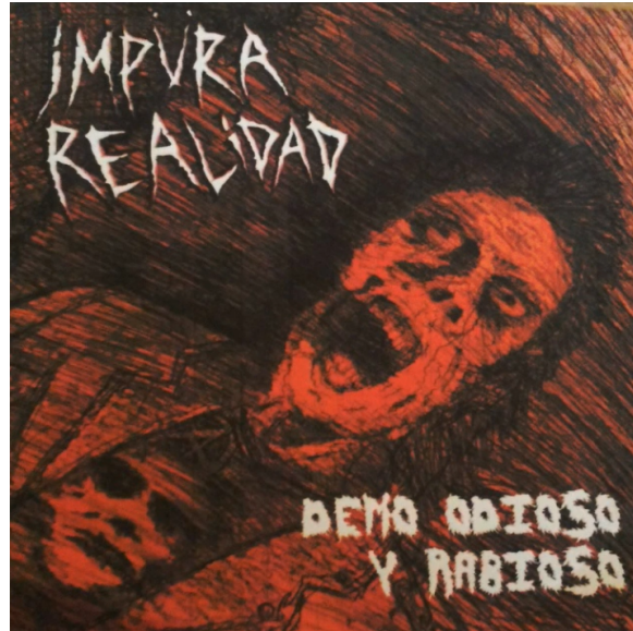
Portada del demo “Odioso y rabioso” año 2018

vez, la batería ejecuta el ritmo de punk clásico de manera muy acelerada y el bajo realiza un arpeggio en Am, ya que volvemos a la tónica inicial de la canción. Luego volvemos a repetir la estructura que ya vimos, osea la parte “A”, pre- estribillo y estribillo. Luego de esto el bajo toca la armonía de la Intro, pero la duración de las vueltas son más largas, ejecuta semicorcheas, paralelo a esto la guitarra comienza a hacer un solo, en el clímax de este solo la batería toma un ritmo acelerado junto al bajo, la sonoridad es caótica, recordando a los solos que se suelen hacer en el género del thrash metal. Un ejemplo de esto sería el solo del tema “Thrash maniacs” de la banda brasileña Violator. terminada esta sección el bajo mantiene la armonía ejecutada en el solo pero la batería baja la intensidad, ejecutando un patrón de punk clásico (bombo, caja y de vez en cuando toca 2 veces en bombo) y con golpes de semicorcheas en el hi hat, la voz es rápida, dejando claro el mensaje que se quiere transmitir. luego la guitarra entra y mantiene la armonía ejecutada, la canción se acelera volviéndose más frenética y se repite en muchas vueltas de compás esta sección, Luego volvemos escuchar el ritmo que se ejecutó en el pre estribillo y luego en el estribillo. para después acabar la canción.