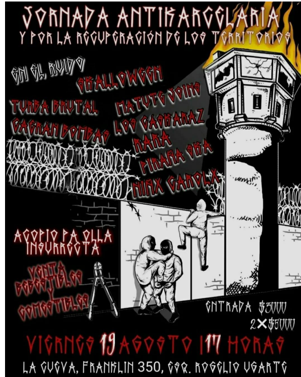
Afiche "Jornada antikarcelaria" año 2022