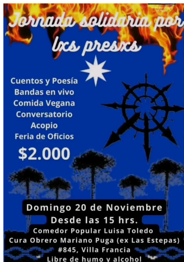
Imagen 1 Afiche “Jornada solidaria por lxs presxs” año 2022

Dentro de estas “tocatas” que se fueron armando, la gran mayoría era para exigir la liberación de las personas que fueron detenidas en la revuelta social ocurrido en octubre del 2019. Muchos jóvenes, dentro y fuera de la escena punk fueron víctimas de montajes realizados por carabineros de Chile y se les acusó de cargos. Se tiene registro de que fueron más de 200 personas detenidas. Dentro de estos eventos que se organizan, se busca juntar colectas para llevar alimentos perecibles y ropa a las personas detenidas.