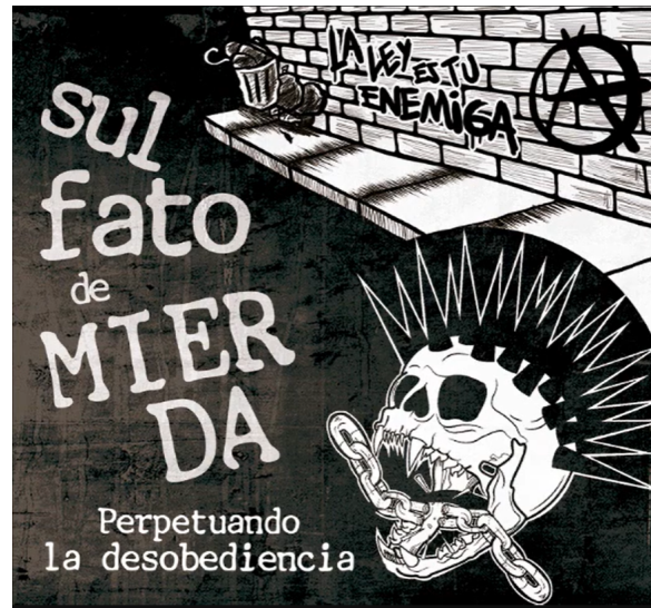
Portada disco “Perpetuando la desobediencia” año 2019