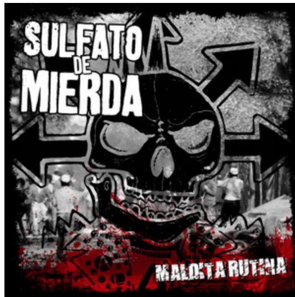
Disco “Maldita Rutina” del año 2016

escuchando a lo largo de la obra. Esta estructura que revisamos se repite por segunda vez. Terminando el coro volvemos a escuchar las guitarras ejecutando el palm mute pero la estructura de la voz cambia, siendo pausada y entrando al comienzo de las vueltas melódicas. El tema termina de una forma similar a la introducción, la guitarra deja sonando un acorde mientras el bajo continua con el patrón rítmico y melódico junto a la batería que replica el patrón utilizado en la intro. La guitarra vuelve a realizar los sonidos de golpear con la uñeta las cuerdas y dando fin a la canción con el acorde principal que se ha estado ejecutando a lo largo de esta.