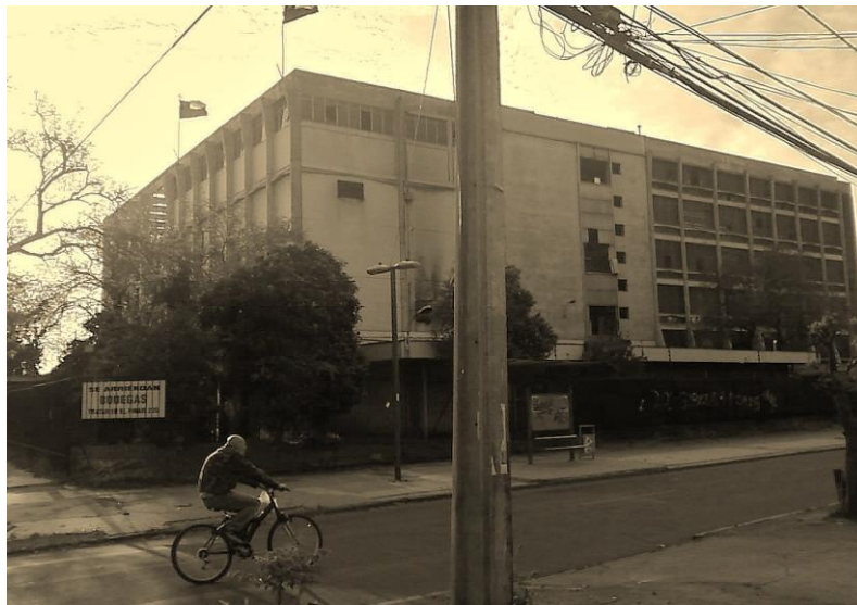
Industria SUMAR. Población El Pinar, San Joaquín. Santiago, Chile 2 .

Poco es lo que se sabe acerca de la población El Pinar en el ámbito de la historiografía nacional. Esta población, que se levantó en el año 1956 va a desarrollar una identidad comunitaria muy rápida, y esto se debió a la industria textil que habría de instalarse en aquel lugar en el año 1958, la cual permitió que una gran parte de los hombres que habitaban en aquella población trabajasen en dicho lugar generando rápidamente un conjunto de lazos y relaciones, articulando una identidad que habría de girar en torno a esta industria. Así en palabras de uno de los dirigentes de dicha industria, para aquellos años, “el icono del barrio, o sea, la Sumar simboliza todo lo que simboliza el Pinar” . Es importante rescatar aquello a lo que este poblador y dirigente de dicha industria se refiere, es decir, el icono.