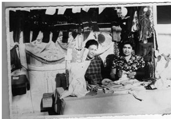
En la foto aparecen dos señoras vendiendo los artículos que fabricaban en el centro de madres, atrás se alcanza a leer PINAR

“...sindicato de algodón organizó para los años 1972 el festival de la canción de la Sumar, involucrando a una gran parte de la población, festival que cobró mucha importancia dado la aceptación popular que tuvo y se quiso comenzar hacer todos los años. La idea era extender el festival a las poblaciones que fuesen partícipes, todo esto con el auspicio de los cuatro sindicatos de Sumar. Además se vieron beneficiadas las poblaciones con la venta directa de los sindicatos. Gran parte de la producción se vendían directamente a las poblaciones. Se crearon las bibliotecas populares. Para beneficiar a los propios trabajadores y pobladores se hizo convenio con otras empresas, para comprar a bajos precios viceversa después se les descontaba de las planillas” 57 .