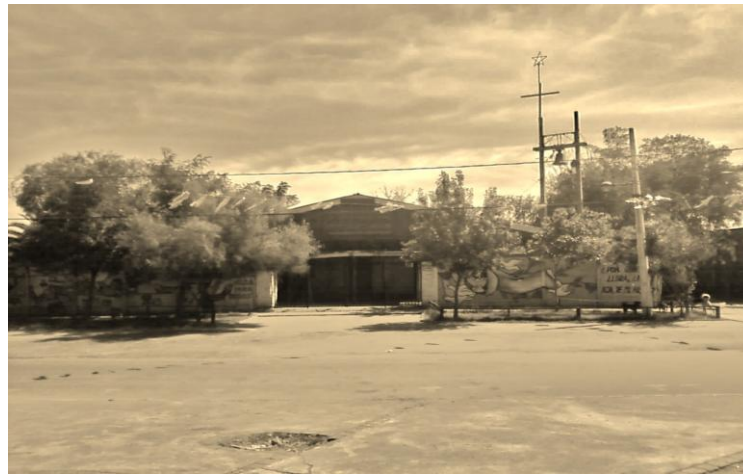
Parroquia San Cayetano. Población La Legua. Santiago, Chile

el miedo [el cual varios de los entrevistados recuerdan y nos pueden contar desde su propia vivencia y como población 49 ] de que al momento de organizar cualquier tipo de movimiento u organización popular de carácter más subversivo, estarían siendo observados. Es por esta razón que mucha de la gente que tenía algún grado de concientización política y social, y compromiso de lucha, dirigiera su mirada no al interior de la población, sino que al contrario, a la población vecina La Legua, en donde lo que se conoce como la Parroquia de San Cayetano, fue epicentro de los movimientos sociales y políticos en dictadura.