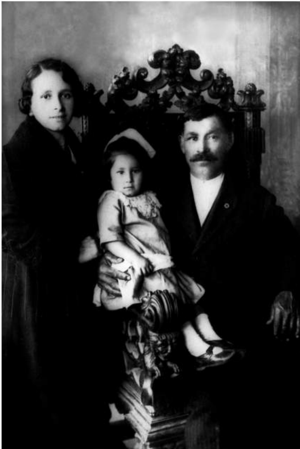
Familia Recabarren Salomón, 1926.