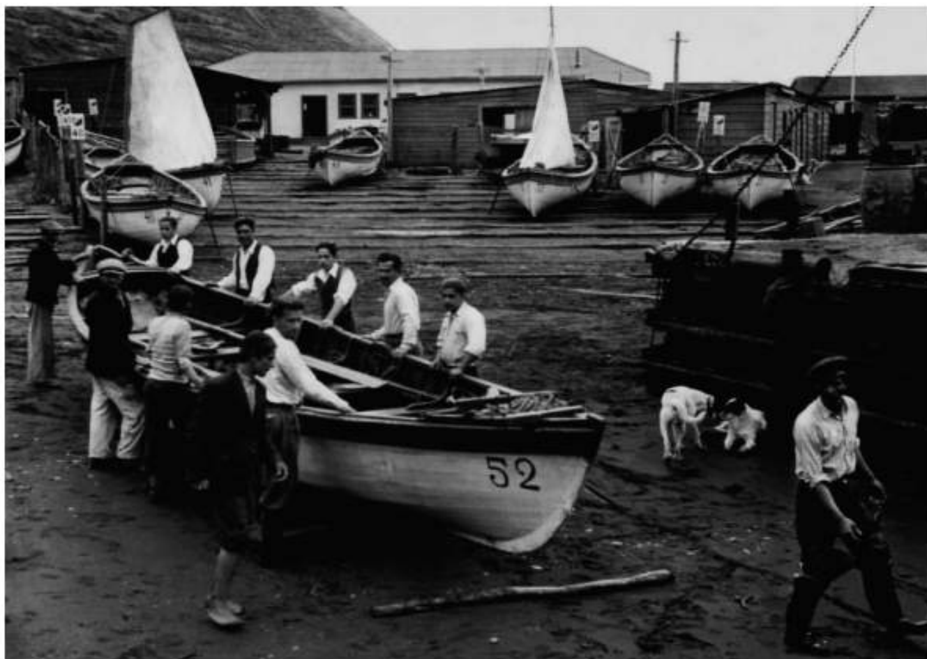
Caleta Isla Robinson Crusoe, años 20.