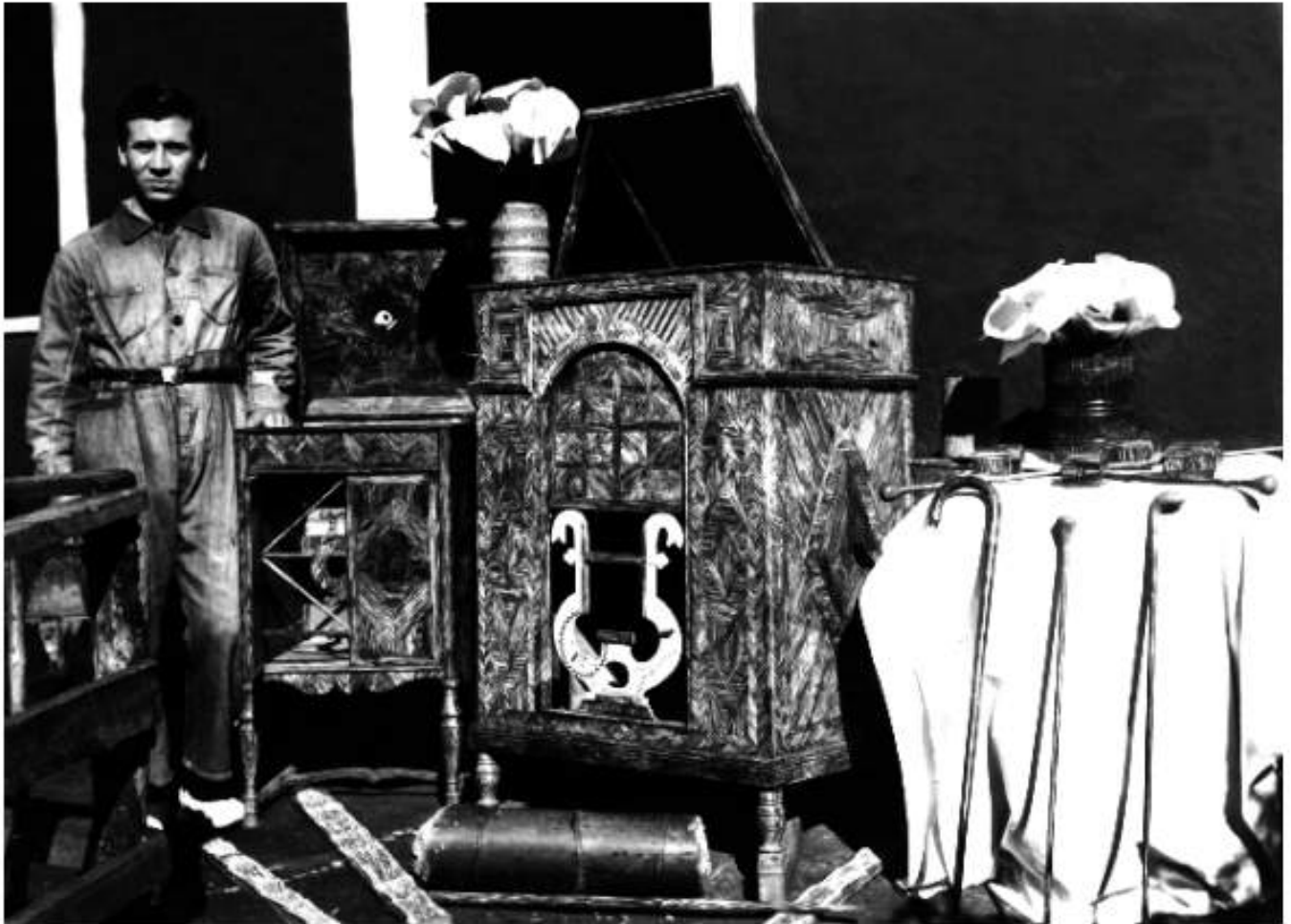
Carpintero, madera Chonta.