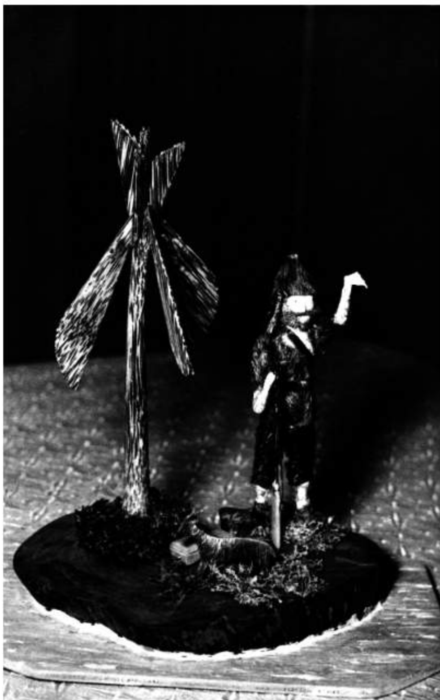
Artesania, Chonta.