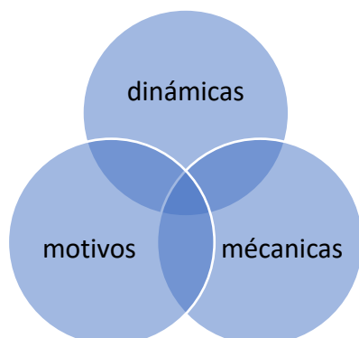
Ilustración 1: Niveles que contienen la estructura de la gamificación, propia autoría basado en (Gené, 2022)

Haciendo una recapitulación de los elementos de diseño de juegos para gamificar que contienen las dimensiones para la creación de un juego