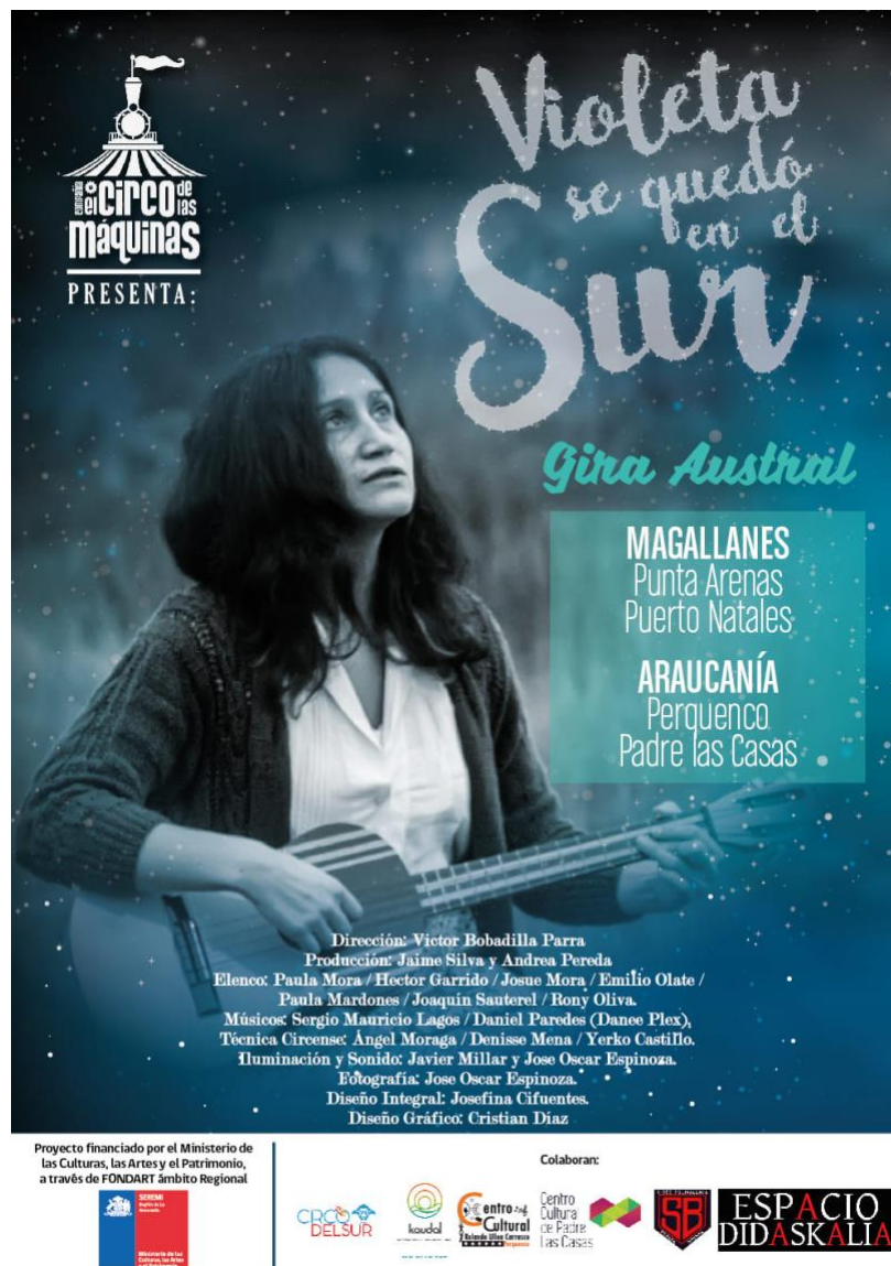
Imagen n°7. Año 2018. Afiche del Fondart Regional 2018, Extraído de: https://www.facebook.com/elcircodelasmaquinas/

Por último Wampo (2018), es un proyecto de investigación de nuevos lenguajes circenses en comunidades. La compañía dramaturgica El Circo de las Máquinas, desarrolla este trabajo luego de talleres realizados en las escuelas rurales de Padre Las Casas y Perquenco. Con esta creación artística se busca mostrar la diversidad geográfica del territorio.