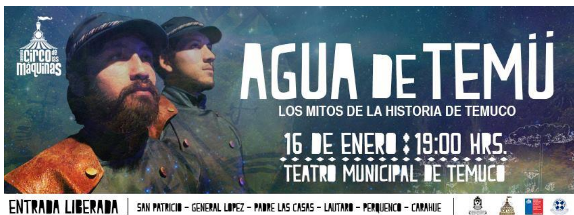
Imagen n° 5 Afiche del estreno Agua Temu en 2015. Extraído de: https://www.facebook.com/photo/?fbid=946054472136671&set=a.504201755042097

Teniendo dentro y plasmada la historia de los varios obreros y de la gente que murió en ese lugar. La idea de este proyecto, era poder hacer un homenaje al lugar recuperando el concepto de la memoria y la ciudad, para eso se habla de Pablo Neruda y de la ciudad en donde está el museo ferroviario. También se habla acerca de la infancia de Neruda, cuando vivió y creció en Temuco, ahí fue donde también se inspiró en toda la esencia bohemia de la ciudad. La intención era poder hablar de lo mágico, mezclando el concepto de los ferroviarios para intentar unir la narración dentro de los números de circo. La compañía, en esta obra, tuvo el primer acercamiento a una dramaturgia en los números circenses, por lo cual aún se veía una fragmentación en la narración y el número circense, pues se estaba explorando la hibridación de estas dos disciplinas desde un primer entrelazamiento no concretado en su totalidad.