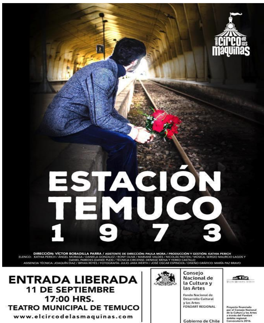
Imagen n° 6. Afiche Estación Temuco. 2016. Extraído de: https://www.facebook.com/photo/?fbid=1155185057890277&set=a.504201755042097