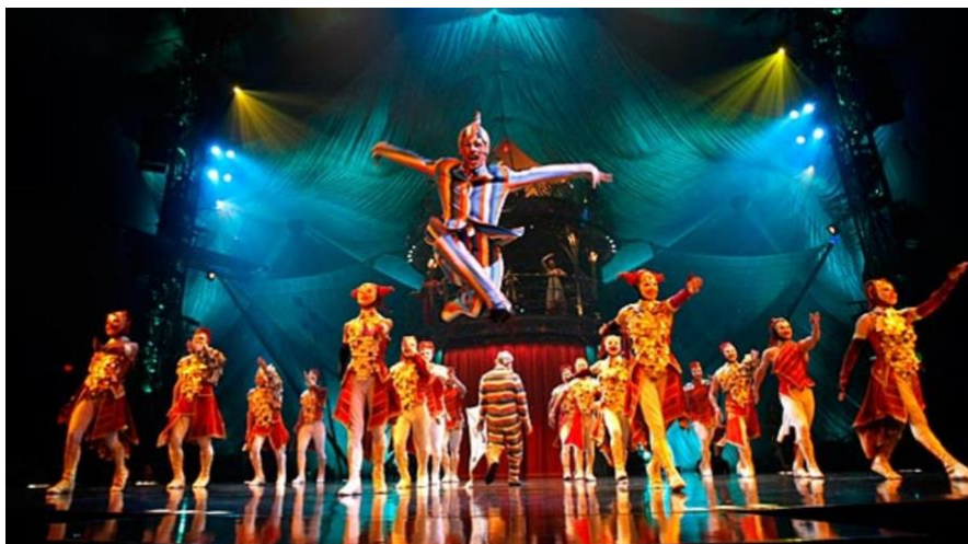
Imagen nº 1: Espectáculo We Reinvent the Circus (1990). Extraída de https://mubi.com/films/cirque-du-soleil-we-reinvent-the-circus

Se destaca el personaje de la Reina, que porta otro vestuario, más elegante y brillante, aludiendo a su clase social. En este número, la compañía habla del reino de fantasía que sus personajes han construido y que los hace dudar acerca de si es real o un sueño lo que viven día a día. De esta manera, en cada uno de sus actos se puede ver el asombro con el que realizan y observan cada acrobacia o momentos de destreza.