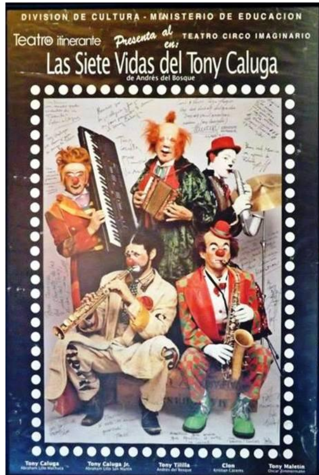
Imagen nº 2: Afiche de Las siete vidas del Tony Caluga.