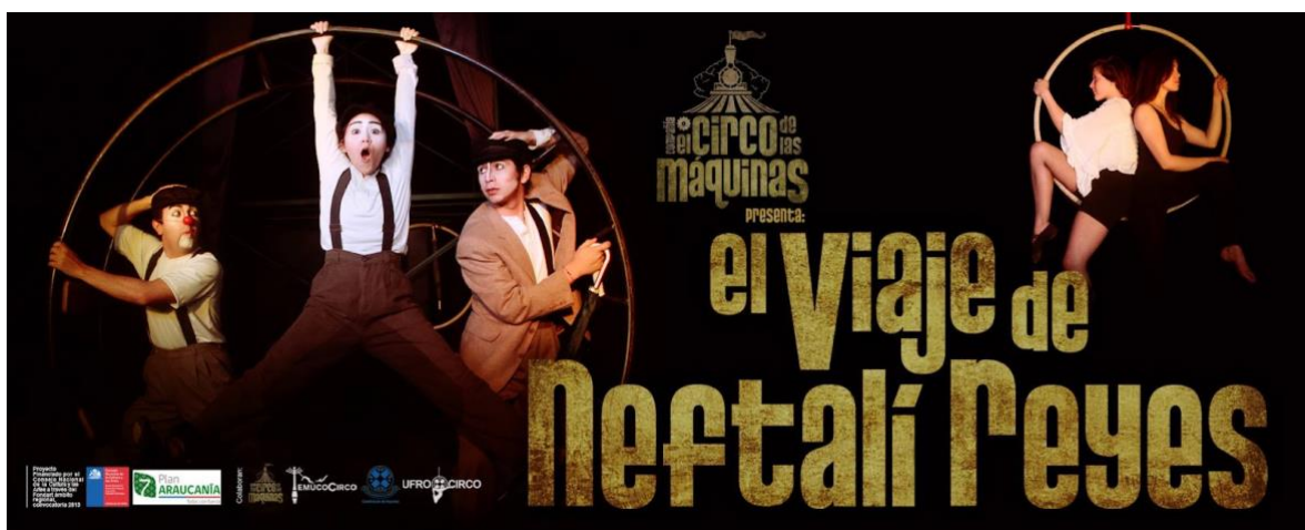
Imagen n°4. Afiche de Montaje de la compañía el circo de las máquinas. Año 2013. Extraída de https://www.facebook.com/photo/?fbid=554986324576823&set=a.504201755042097