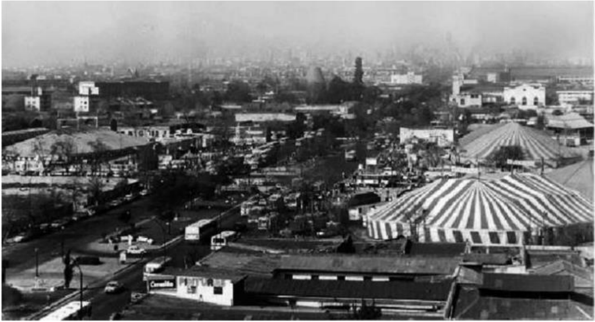
Imagen n° 2: Circos en Avda. General Velásquez con Alameda. Santiago, Chile. ca. 1980. (Oxman, 2009, p. 8).

Transcurrida la década 1990, ingresó en nuestro país el «Nuevo Circo»: