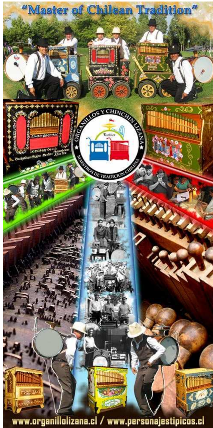
(Imagen de presentación de la web de la familia Lizana) 219 .