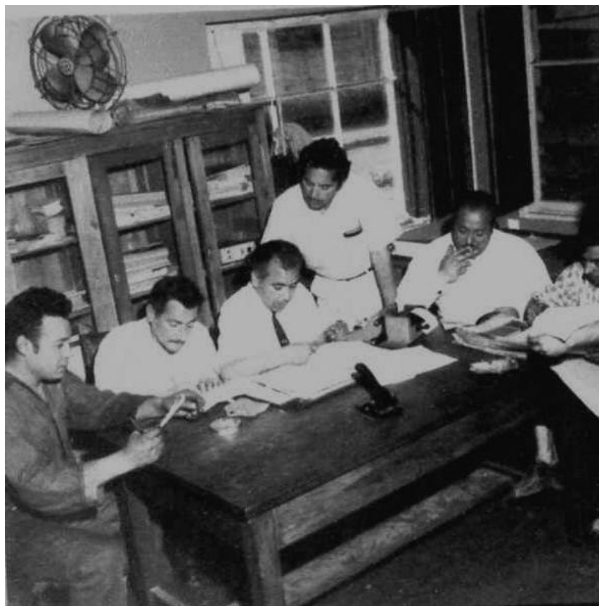
Directorio de Cootalaco 1972.