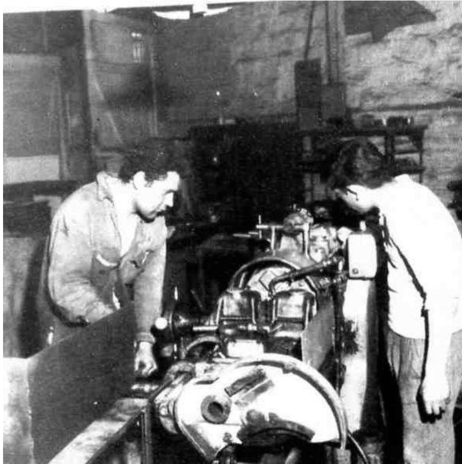
Trabajadores en Maquinaria de Cootralaco