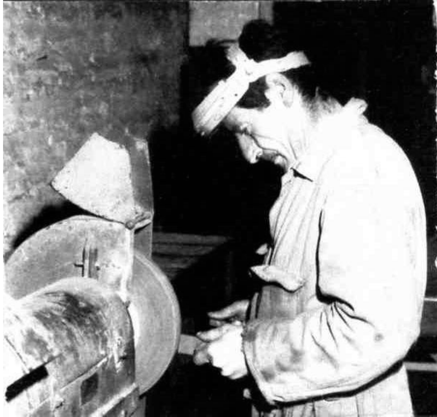
Trabajador de Cootalaco