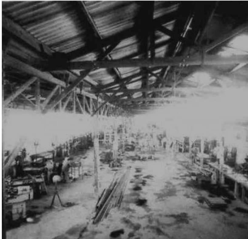
Maestranza de la Fábrica Cootalaco