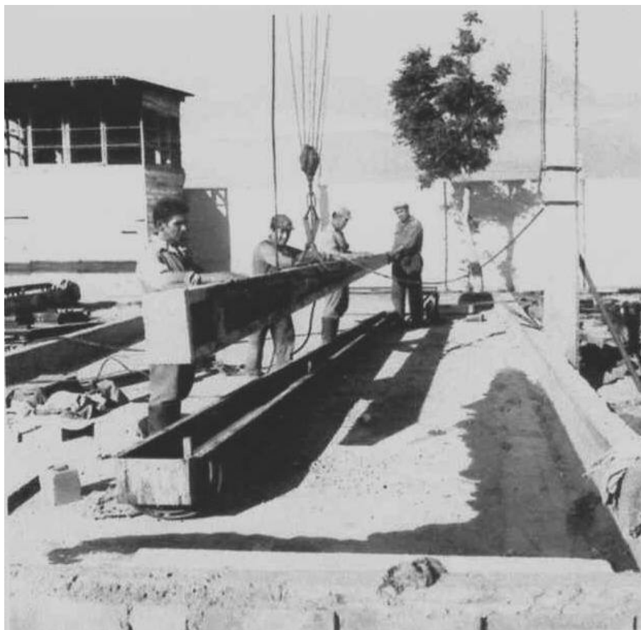
Construcción de Postes de Luz