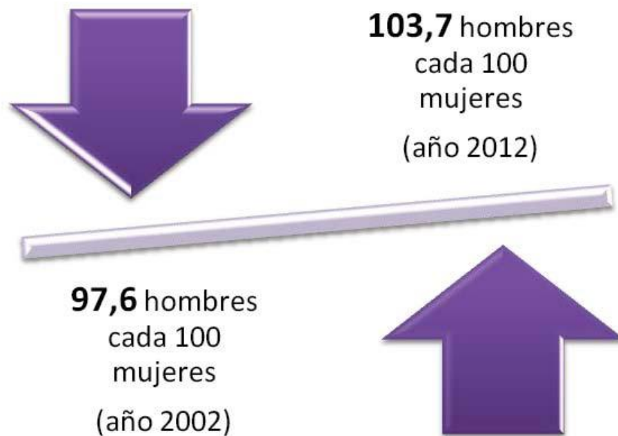
Cuadro N°2: Distribución de la población de la comuna en relación al aumento de población masculina con respecto a la femenina.