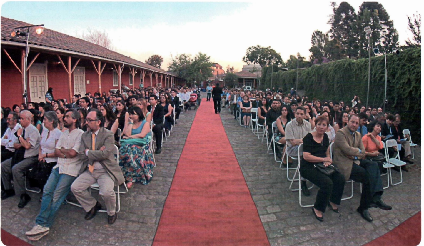
ASISTENTES. Autoridades de la Academia, docentes, estudiantes titulados y sus familiares y amigos participaron en las ceremonias efectuadas en el Centro Cultural Montecarmelo.