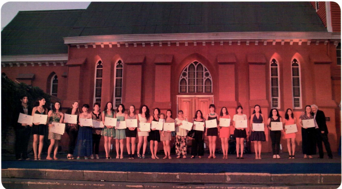
DANZA. Egresadas exhiben sus diplomas.