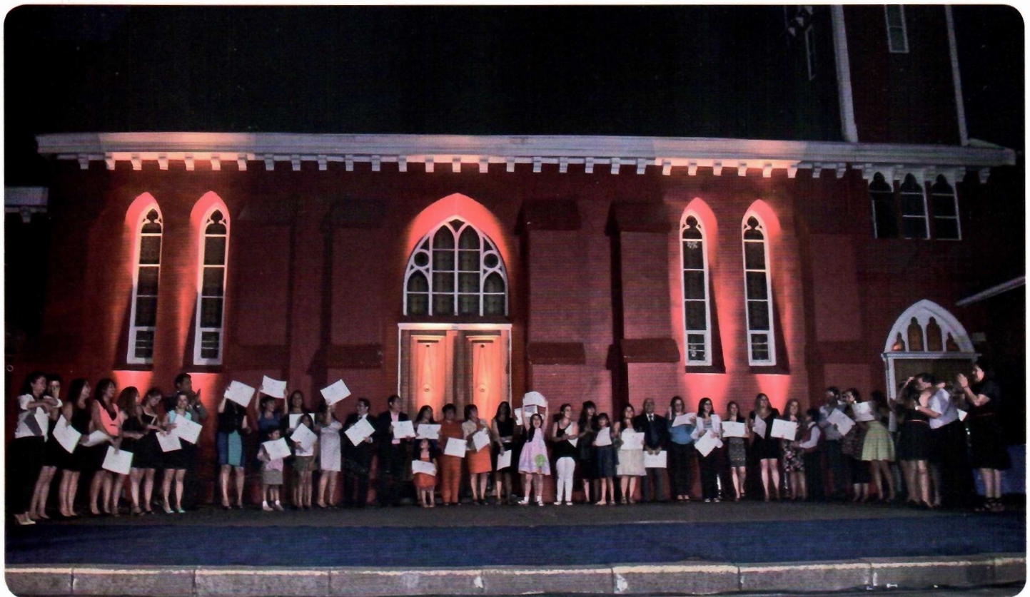
TRABAJO SOCIAL. Parte de los titulados de Trabajo Social.